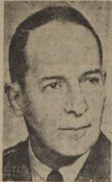
El general Mac Arthur

WASHINGTON, 9. — (Especial). — Hace un año en esta fecha, un ejército japonés, fresco, bien alimentado y completamente equipado, sabiendo que todas las ventajas estaban en su favor, penetró a la península de Bataan para terminar con sus defensores norteamericanos y filipinos, medio muertos de hambre, febriles y padeciendo de disenteria y de cansancio. La batalla de Bataan quedó terminada al ceder sus defensores.