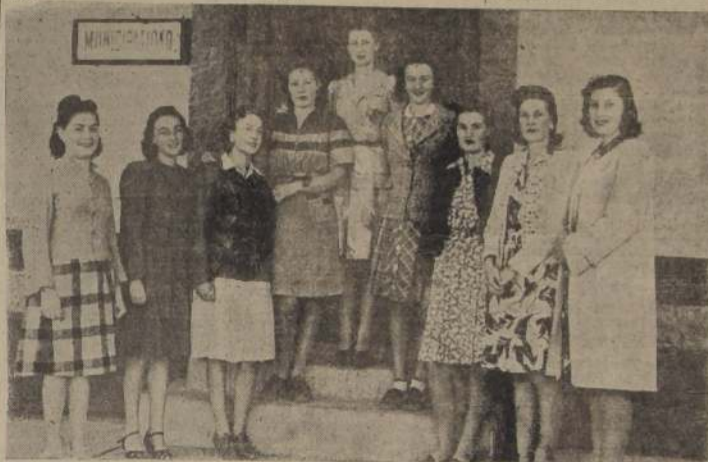
La Reina de la Fiesta de la Vendimia y sus damas de honor

Viña Siembra Criadero de Caballos Engorda de Vacunos