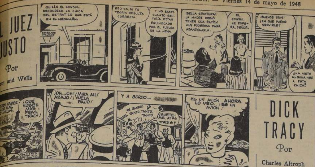
DICK TRACY Por Charles Altroph