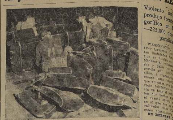
PARIS. — Operarios sacan los asientos del teatro que hay dentro del Palais de Chaillot para dar espacio, a fin de que en el pueblito de la Asamblea General de las Naciones Unidas, se celebren sesiones en París, a partir de agosto del presente año.