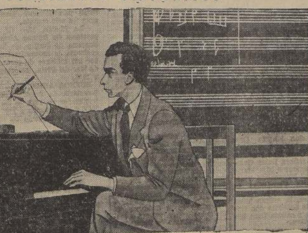
Juan Orrego Salas, compositor chileno