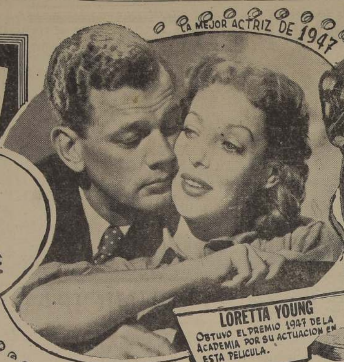
LORETTA YOUNG OBTUVO EL PREMIO 1947 DE LA ACADEMIA POR SU ACTUACION EN ESTA PELICULA.