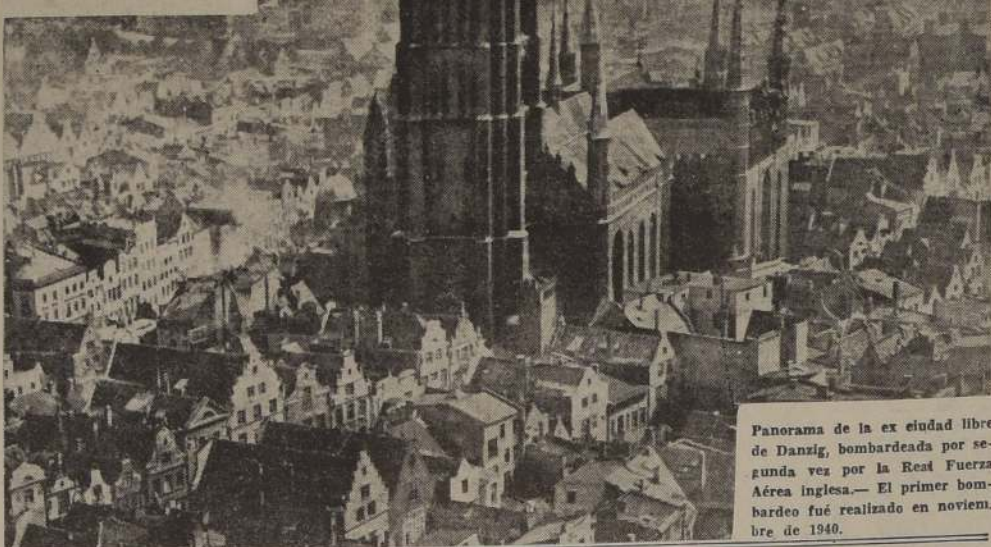
Panorama de la ex ciudad libre de Danzig, bombardeada por segunda vez por la Real Fuerza Aérea inglesa.— El primer bombardeo fue realizado en noviembre de 1940.