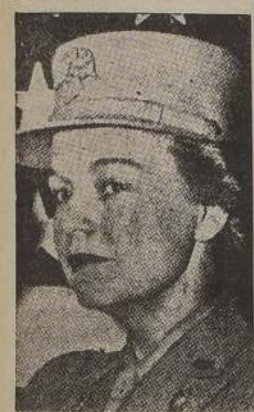
Oveta Culp Hobby, jefe del Ejército Auxiliar Femenino en formación