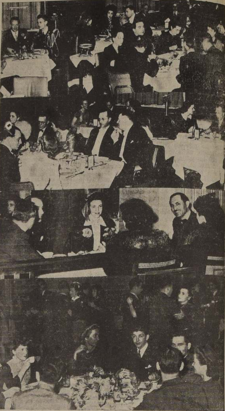
Diversos aspectos de los salones del Carrera que, como de costumbre, son visitados por un público selecto y distinguido que a diario disfrutan de su agradable ambiente. Las fotos que publicamos corresponden al Roof-Garden, Grill-Room, Living, etc.