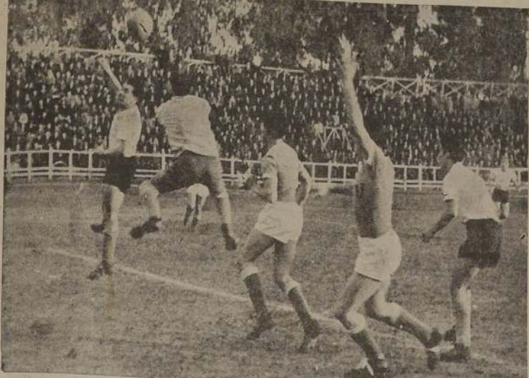
Centra Sorrel y Vergara va a cabecear; pero Ibañez advierte la jugada y sale a tiempo. La "U" tuvo una defensa magnífica, bien distribuida y sin fallas.