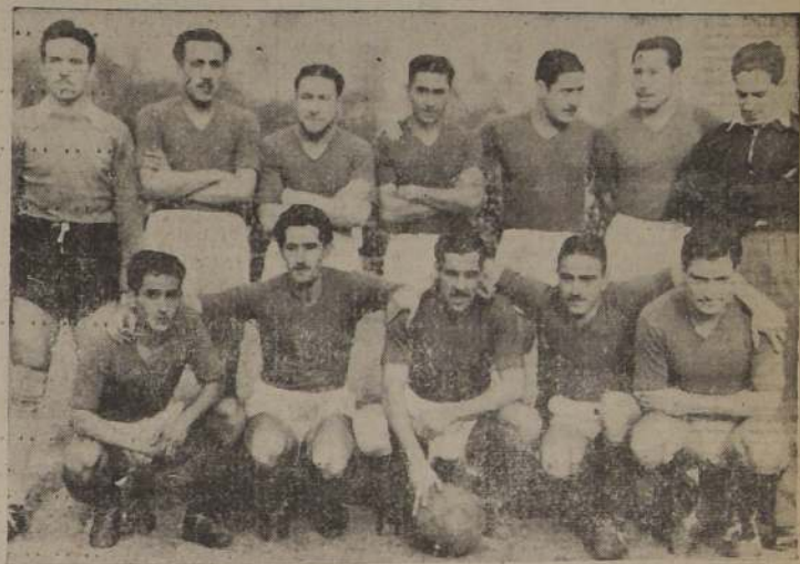
Conjunto del Audax Italiano, que ocupa mercedemente el primer puesto del campeonato profesional de fútbol. Su match del domingo con Magallanes adquiere proporciones de gran interés.