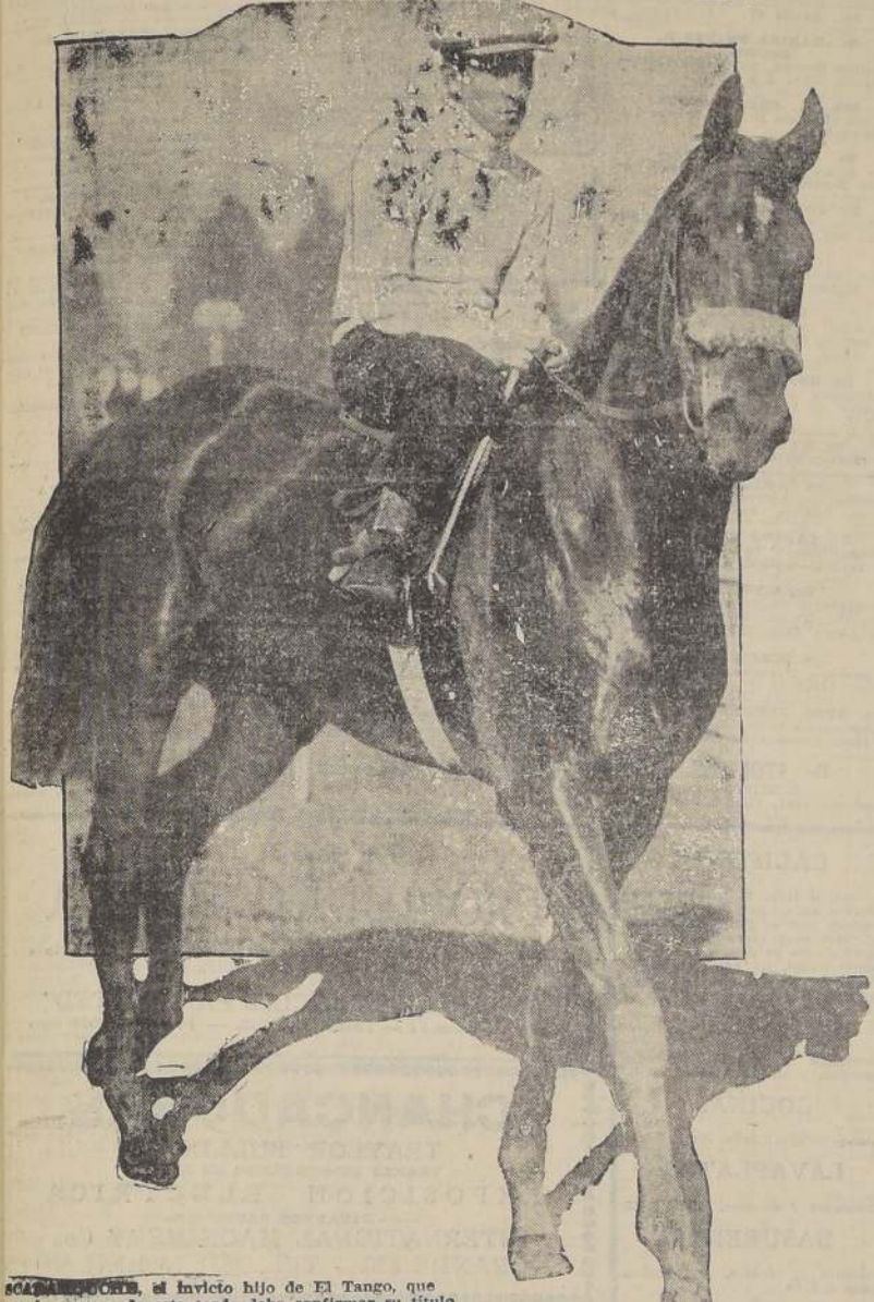
SCARAMOUCHE, el invicto hijo de El Tango, que en la carrera de esta tarde debe confirmar su título de "as" de la generación.