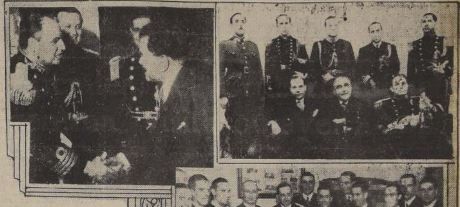
Los marinos argentinos durante su visita al Presidente de la República, al Ministro de Defensa Nacional, al Centro Argentino y al Ministerio de Relaciones Exteriores.

conversaron cordialmente con el Excmo. señor Aguirre Cerda, sobre diversos tópicos. S. E. les manifestó su complacencia de recibirlos y su deseo de que su estadía en tierra chilena les fuera grata.