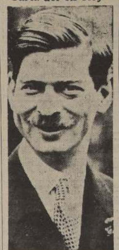
El ex Rey Carol

de los manifestantes hubieran disparado contra las tropas, y agregó que solamente había habido encuentros entre grupos rivales de manifestantes. Declaró que hasta 10 minutos después de la medianoche no había habido detenciones, pues la policía tenía instrucciones para repeler a los manifestantes disparando al aire o empleando mangueras contra incendios, pero de no efectuar detenciones. El diario matutino de Gafencu, "Timpul", en su primera página, anuncia que las manifestaciones de anoche de los guardias de hierro iban encabezadas por Horia Sima y al describir la columna de guardias de hierro que pasaba cantando, dice: "En medio de ellos se vio que estaba Horia Sima". En estas bien informadas se insinúa que este último que, según se decía, estaba oculto en Brasov, después del fracaso del golpe en que fueron distribuidos volantes que pedían la abdicación de Carol, y llevaban la firma de Horia Sima, organizó las manifestaciones, con el objeto de proclamar su lealtad al nuevo Rey y a Antonescu.