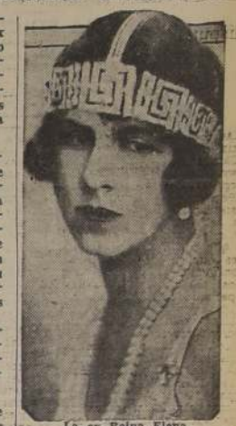
La ex Reina Elena

BUCAREST, 6. — (U. P.). — La radio anunció que la ex reina Elena había llegado a Rumania en un tren especial, indicando así que debió haber salido de Dresden en las primeras horas de esta mañana. No daba mayores detalles. La ciudad esperaba ansiosamente el regreso de Elena. Se le preparó un gigantesco recibimiento. La última vez que la reina estuvo en Bucarest, fue cuando vino apresuradamente de Londres para llegar a un acuerdo con Carol y su Gobierno, sobre una asignación suficiente para sus gastos. La Radio había anunciado antes que Antonescu había telegrafiado a la ex Reina Elena, a Dresden, diciéndole: "En los momentos en que todo el pueblo rumano aclama la asunción del príncipe Miguel al trono, yo, general Antonescu, os ruego que toméis el primer tren para ocupar vuestro lugar al lado de vuestro hijo y completar su educación, para la felicidad de toda Rumania, y con este acto estoy feliz de poner fin a todos los sufrimientos a que V. M. ha sido sometida". Antonescu había nombrado a uno de sus íntimos amigos, el coronel Alexan-