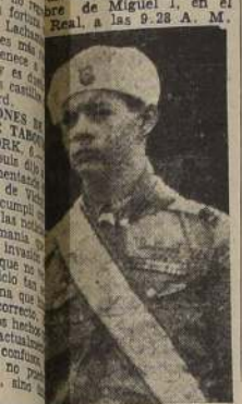
El ex Rey Carol II