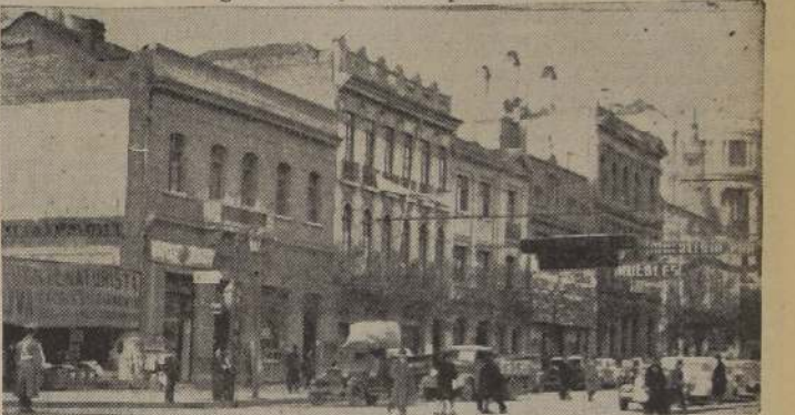
Edificios ubicados en la Avenida O'Higgins entre Morandé y Bandera, que pronto serán demolidos para dar paso a una moderna y valiosa construcción

En breve se comenzará la demolición de los que están ubicados en la Avenida Bernardo O'Higgins, entre Bandera y Morandé, para edificar una valiosa obra arquitectónica. — Una nueva calle destinada a descongestionar el tránsito público