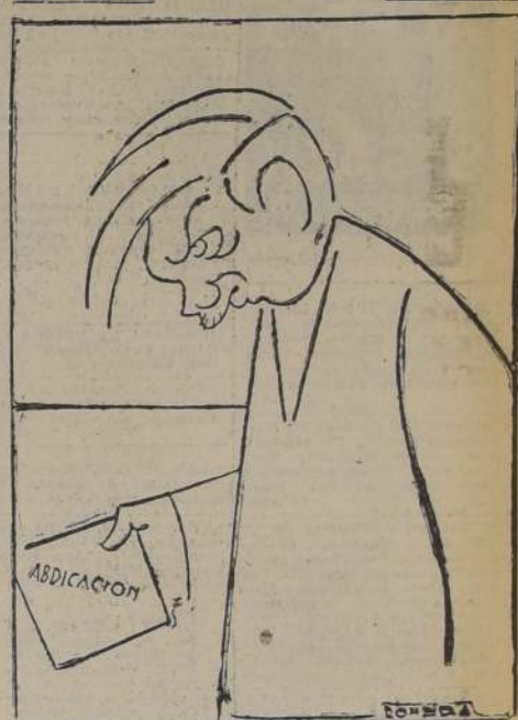
CAROL: — ¡Me han partido por el 'Eje'!