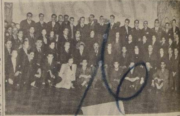
Grupo de asistentes a la manifestación ofrecida en el Hotel Savoy a don El por el personal de las firmas Hilandería Nacional, S. A. y Tejeduría Real.