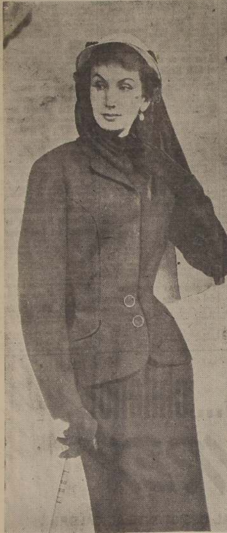
MODA LONDINENSE.— La tela de lana más suave y fina ha sido utilizada en la confección de este modelo, creación de Matelli, con su chaqueta corta y sus adornos procurados por la costura que da una esbelta línea de cintura. Los bolsillos continúan la línea de la costura del costado.

Delante del niño, abstenerse de toda reflexión acerca de sus actitudes en el momento de la comida. Abstenerse también de comparar o identificar sus gustos con los de algunos de sus progenitores.