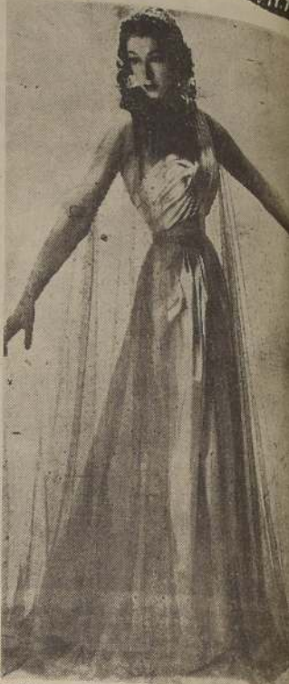
"FETE", modelo de la Casa Robert Piguet, gran capa de tul bordado de lentejuelas.

Tener la ropa blanca perfumada es cosa que resulta muy agradable. Para ello es suficiente espolvorearla con clavos de especia machacados. Esto tiene por añadidura, otro beneficio nada despreciable: el de ahuyentar a la polilla. De ahí que muchas dueñas de casa la utilicen en unión de la naftalina para neutralizar el penetrante olor que ésta exhala.