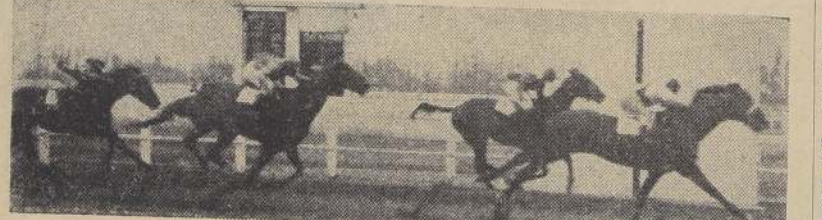
Llegada del clásico La Palma. — 1.º Monte Aguilá, 2.º Altamira, 3.º Paimpol, 4.º Barbaridad