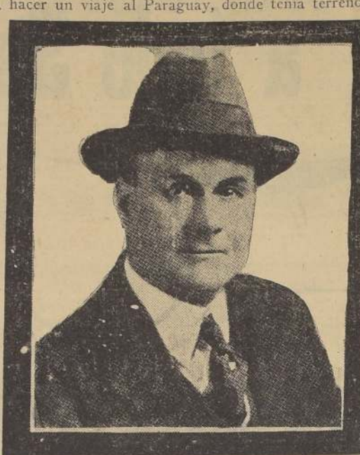
Tex Rickard, el popular empresario del Madison Square Garden

Se recuerda que Rickard vivió en una ocasión en la Argentina, siendo dueño de un frigorífico en la provincia de Corrientes, el que