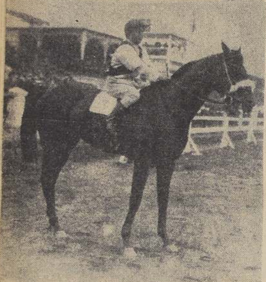
Alhué, vencedor de la prueba de fondo del Hipódromo Chile. Jockey: Muñoz.

los 900 metros, al tiempo que se adelantó a la punta, pero luego fue sustituido por Alhué, quedando segundo El Clarín, tercero Epíro y a continuación Navas de Tolosa. Rendida, Katerfeto y Legionario con Castas en la última línea, orden en del grupo, perseguido