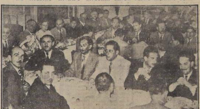
Aspecto de la manifestación que el Automóvil Club Argentino ofreció a los periodistas extranjeros en su magnífica sede. Aparte de los invitados de honor, concurren más de 300 personas.

QUE CONCURRAN AL CAMPEONATO SUDAMERICANO NO DE BUENOS AIRES.— (DE NUESTRO ENVIADO ESPECIAL, SEÑOR PEDRO GAJARDO C.)