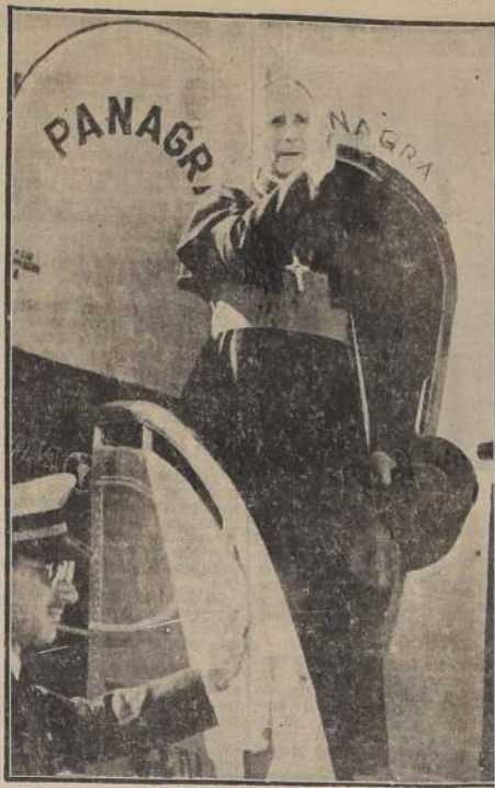
Su Eminencia, el Cardenal Caro, imparte la bendición al público que fué a despedirlo a Los Cerrillos