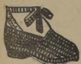
ART. 1 PESOS 82.—

Alparga vasca con taco, de yute grueso. Duración un año! Lleva plantilla interior de goma, para mayor suavidad. Nos 33 al 39