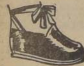
ART. 5.— Modelo corriente, sin taco, calidad extra, en azul y lacre. Nos 30 al 44. PESOS 25.—

Por mayor, desde una docena, grandes descuentos. Provincias reembolsos, se envía el mismo día. No se recarga gastos de ninguna clase.