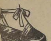
ART. 2.— Lona azul, rojo, verde, amarillo y negro. PESOS 65.—

LONA como el dibujo, azul, con blanco, muy grueso, de tela a mano