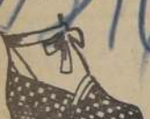
ART. 4.— Lindo modelo, género importado, hilo con seda, verde, con rojo, amarillo y negro. PESOS 95.—