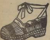
ART. 3.— LONA en colores, con gruesa de tela a mano. PESOS 78.—