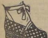
El mismo modelo, en fino borlon de seda importado, Lacre, verde, amarillo, petróleo y concho vino. 120 PESOS