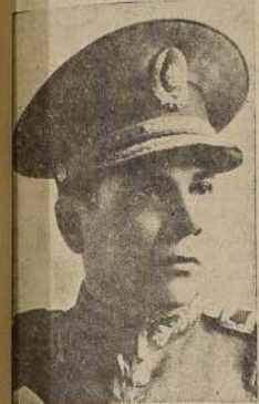
Excmo. señor Higinio Morínigo, Presidente de la República de Paraguay

Paraguay celebra hoy el 131.º Aniversario de su Independencia.