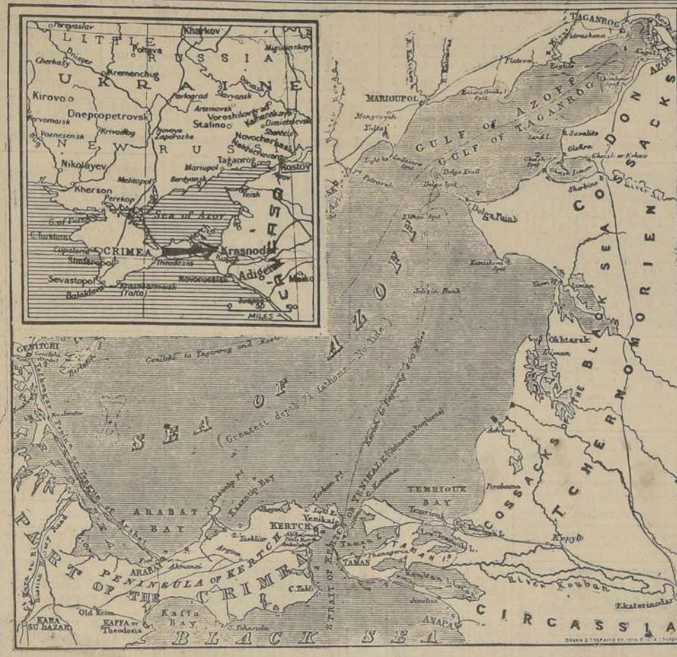
La flecha en el mapa de arriba señala la dirección de la ofensiva alemana. El mapa principal muestra en detalle la península de Kerch, que, en estos momentos es el principal escenario de la lucha en Rusia.

"En combates aéreos sobre la isla de Látvia los cazas alemanos e italianos que escoltaban a formaciones de bombarderos destruyeron a 11 cazas británicos Spitfire. Otros tres aviones en-