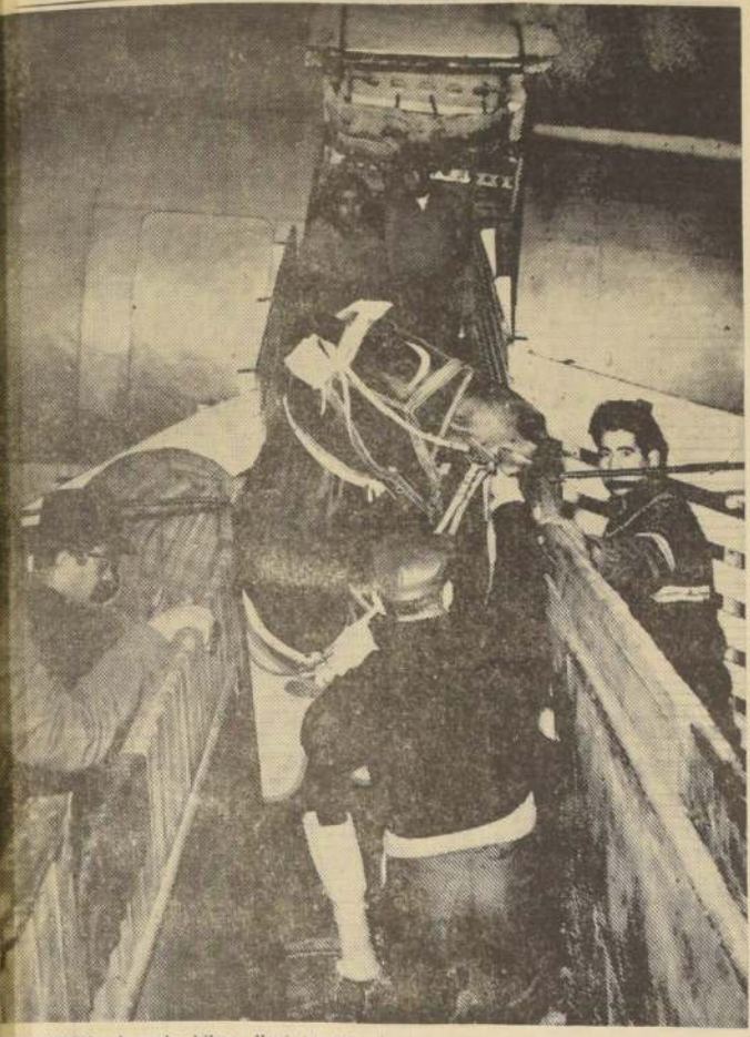
CENCERRO, el crack chileno, llegó en perfectas condiciones a Brasil y deberá afrontar hoy. El domingo enfrentará a un escogido grupo de rivales brasileños, argentinos y uruguayos. Ojalá le vaya bien. Esta fotografía lo muestra en su tranquilo embarque en Los Cerrillos.

RENECO , que cuida Carlos Castro, sufre de una adenitis submaxilar.