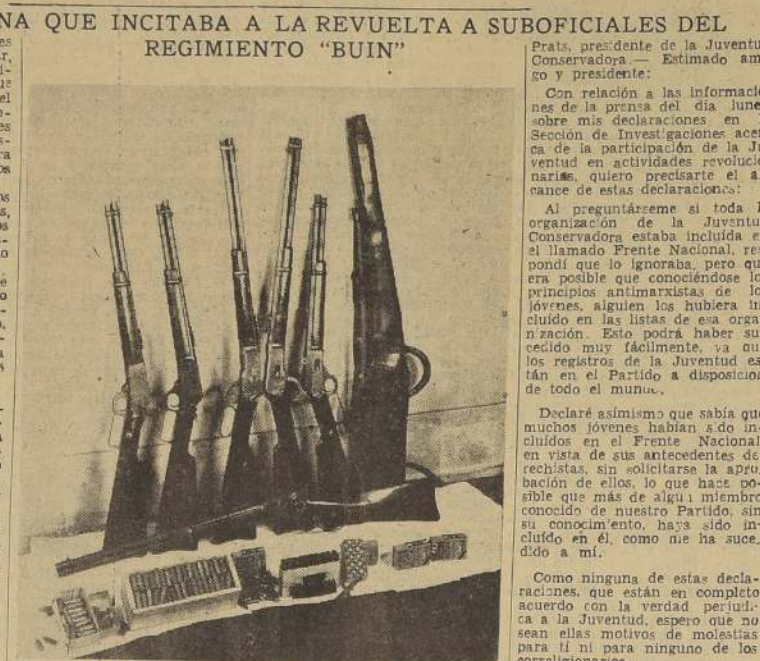
Carabinas y municiones que fueron recogidas en los allanamientos efectuados.