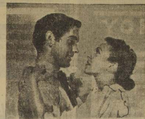
Tyrone Power y Nancy Kelly, protagonistas de "Tierra de Audaces", producción 20th. Century Fox, que estrena el viernes el Metro.

Jesse James fue un rey de la aventura. Fue el primer bandolero del mundo que asaltó un tren en plena marcha. Su existencia galopó por la leyenda, junto a Joaquín Muirata y otros caballeros del camino. Pero, Jesse James, fue un romántico, un gran enamorado. La injusticia lo torció el mundo de su apasionada existencia, por eso la historia de este famoso bandolero despierta simpatía, admiración y asombro. La vida de Jesse James, sus aventuras dramáticas, sus instantes pasionales, la novela de su grande y único amor, toda su biografía asombrosa surge en la película "Tierra de audaces", que estrenará el Teatro Metro el próximo viernes. Tyrone Power, el actor de todas las simpatías, con Henry Fonda, artista que nos visitará hace poco, y Nancy Kelly, forman la plana mayor de los muchos intérpretes que se trae esta nueva producción cinematográfica de la 20th-Century-Fox. Filmada toda en tecnicolor, con un argumento, extraído de la historia y de la leyenda, y con una notable interpretación, "Tierra de audaces" es un modelo de obra cinematográfica por su interés, por su belleza y su dirección artística.