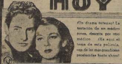
ROBERT DONAT ROSALIND RUSSELL La CIUDADELA

Hoy en POLITEAMA además, estreno Paramount policial 1939, con JOHN HOWARD, en BULLDOG DRUMMOND, DATE PRESO