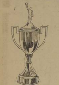
COPAS Sport para premios.