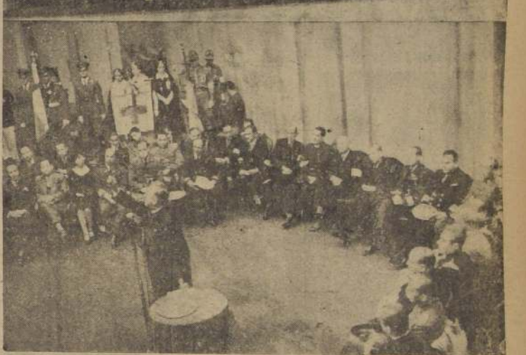
S. E. el Presidente de la República y señora de Ríos, en el Falso Presidencial del Teatro Municipal, presenciando el desarrollo del acto. — El escenario en el momento de hacer uso de la palabra el Capellán Abarrúa

Con todo éxito fueron inaugurados en la tarde de ayer, en el Teatro Municipal, los cursos de capacitación que ha organizado la Defensa Civil de Chile con el objeto de desarrollar una más eficiente labor.