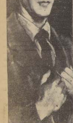
Mr. Archibald J. Kerr Clark Kerr, ex Ministro de Gran Bretaña en Chile, que ha sido designado para el cargo de Embajador de su patria en China

A este propósito, el Foreign Office emitió una declaración, en la que dice que, aun cuando se esperaba que sir Hugh pudiera regresar a ocupar su cargo, no podría hacerlo antes de la primavera. En vista de los últimos acontecimientos, y a pe-