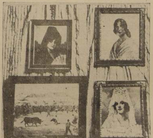
Se anuncia para el jueves la exposición de cuadros al óleo en la Sala de Arte del Banco, entre los cuales se destacan

La Exposición de Obras Pictóricas pro huérfanos y viudas de la revolución española