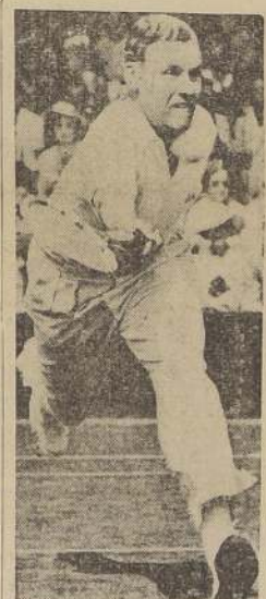
Charles Hare, uno de los mejores jugadores ingleses que junto con Wilde actuará hoy contra Budge y Mako.

Los dos partidos que se han disputado entre norteamericanos e ingleses nos avanzan a la Asociación Atlética Amateur, que midieron la distancia dijeron que no hay ni la diferencia "de un milésimo de pulgada". Los directores de los Juegos manifestaron que el record será sometido a la Asociación Atlética para su aprobación.