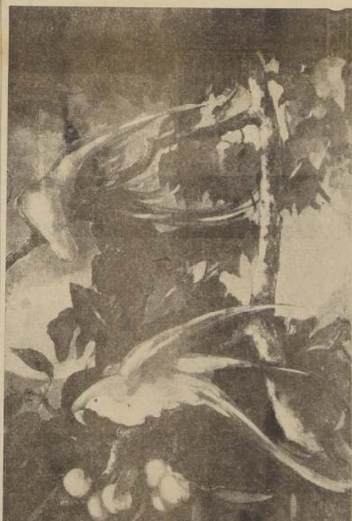
Dúo en la Selva.— De la exposición de cuadros que inaugura hoy Ernesto Barreda en la Casa Ramón Eyzaguirre.

La Exposición de Obras Pictóricas pro huérfanos y viudas de la revolución española