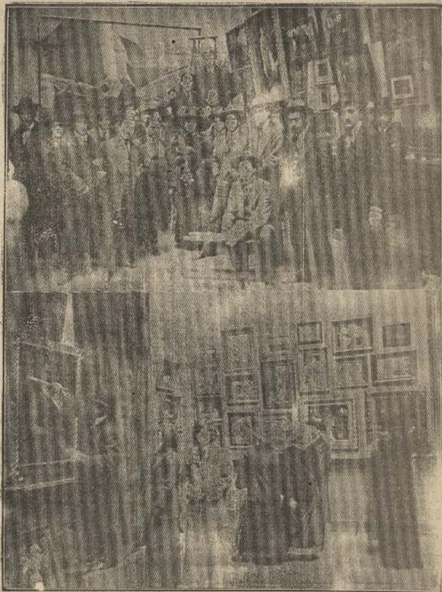
I.—Grupo de artistas y de asistentes al "reent sago" de las obras efectuado ayer en el Salón de Bellas Artes, y dedicado a los intelectuales.—II. Un rincón de la Exposición.