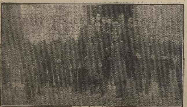
Asistentes al almuerzo ofrecido al Directorio del Club Hípico por el comandante de la Escuela de Caballería.