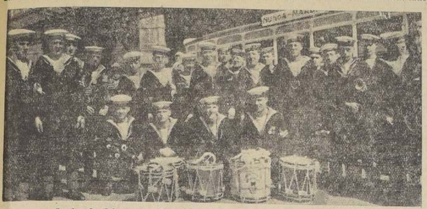
La banda del crucero "Dragón", al llegar ayer a la Estación Mapocho.

La banda se instaló frente a la caseta del juez de carrera, y tocó un escogido programa musical, entre las 11 y las 12 horas.