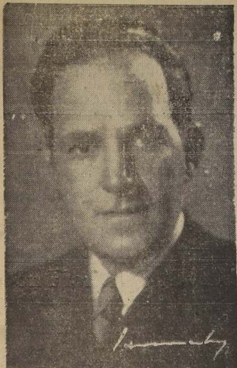
Presidente del Centro Republicano Español. Director-Gerente de la Casa España Republicana. Hombre de acción, del magno proyecto de un hogar propio para el Centro Republicano Español. Su entusiasmo, energía y constancia culminan con el acto inaugural de esta tarde.