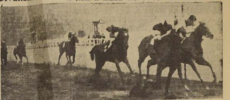
PORT BOU derrota a Gold King y Pasador

LA DE CLAUSURA. Nuestra recomendada Bacarat se impuso estrechamente en la prueba de clausura, derro-