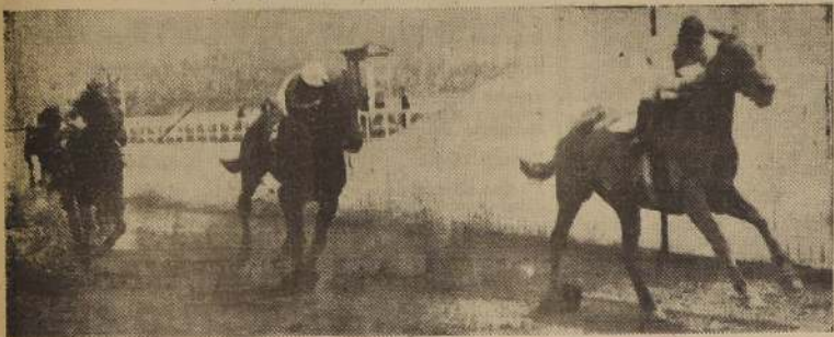
ZITA logra una concluyente victoria sobre Prosit e Indolente en la penúltima