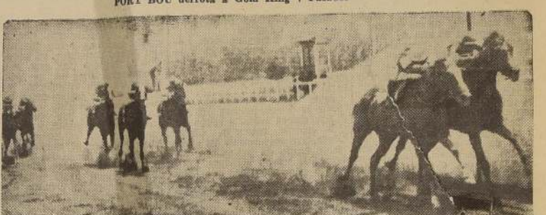
BACARAT aventaja por media cabeza a Sotaquí después de emocionante lucha

ron en lucha con Milanesa por el sitio de honor, llevando Prosit la mejor parte, pero allí fue lanzado Zita, y aprovechando un hueco muy estrecho entre Prosit y Milanesa, pasó con grandes bríos al frente, terminando el recorrido con cuerpo y medio de ventaja sobre el hijo de Otoven, que era el dividendo del día. El tercer lugar, a cuerpo y medio, lo conservó Indolente, delante de Milanesa; quinto