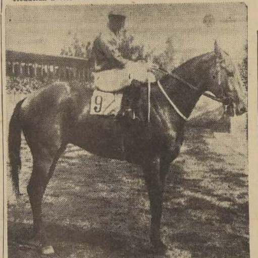
NOVELTY, por Noctovision y Oferta, que salió ayer de perdedores

BOUGANVILLE EN LA QUINTA. Reducida a sólo cuatro adver-