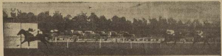
ROCAFINA precede fácilmente a Idealista y Tangerino en la inicial

fina aumentó el claro sobre Idealista, que había desplazado a Martirio.