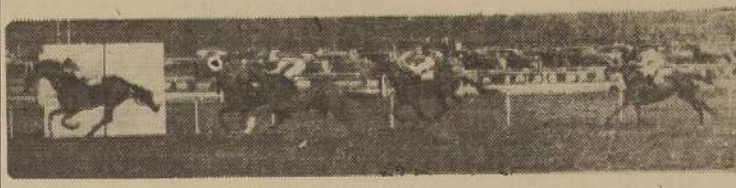
CAYALCA se impone sobre Mailito, Kurul y Kobi en la mejor serie de 1.600 metros

En los metros decisivos, Peregrino afianzó sus posiciones y levantando al freno por su piloto,