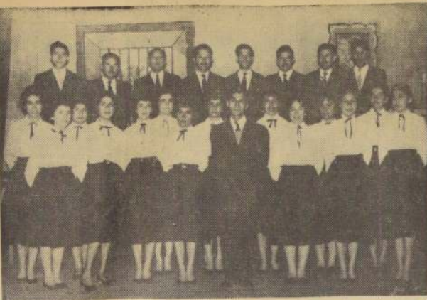
COLO POLIFONICO DE SAN BERNARDO. — Gran actuación tuvo este conjunto en la velada artística efectuada en la vecina ciudad, como número especial de la celebración del 140.º aniversario. En el grabado aparecen, en la primera fila, de izquierda a derecha, Sity 140.º aniversario. En el grabado aparecen, en la primera fila, de izquierda a derecha, Sity 140.º aniversario.

Todos los días, menos el domingo, sale un DC-3 a las 10.30 horas, y un DC-3 a las 12.30 horas, y un DC-3 a las 14.30 horas.