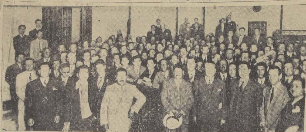
El gremio de lecheros en "La Nación"