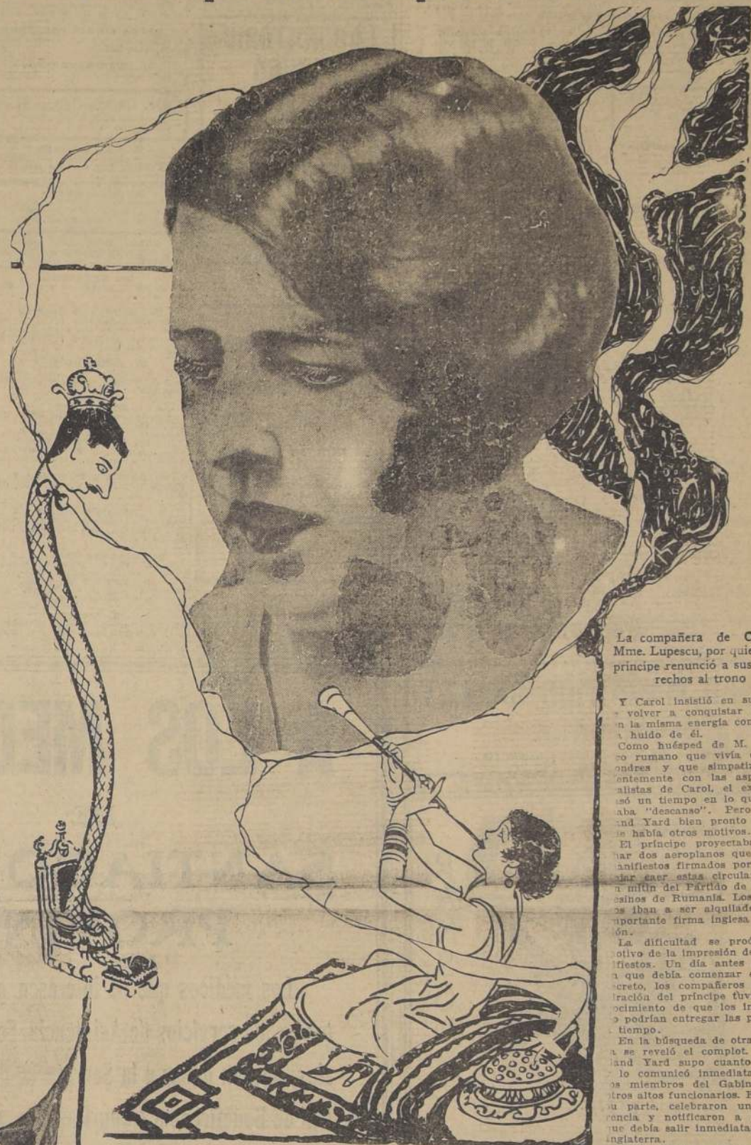
La compañera de Carol, Mme. Lupescu, por quien el príncipe renunció a sus derechos al trono

Un desfile del Partido de los Campesinos, que Carol considera como sus mejores partidarios