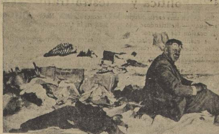
"NOS ARREGLAMOS LO MEJOR QUE PODEMOS"

Decía un lacónico mensaje enviado por los sobrevivientes de la desgraciada expedición del "Italia", antes de que fueran salvados por los buques de socorro.