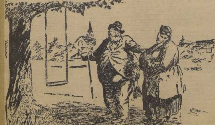
—Vení, Eufrosia! Vamos a columbiarnos los dos juntos, como en otros tiempos.