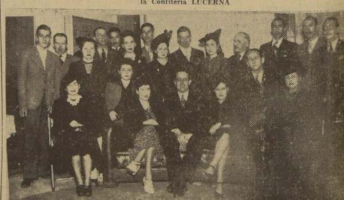
Personal de la "VME de Nice", que festejó con un cocktail servido en el LUCERNA, a su vuelta de Sección.