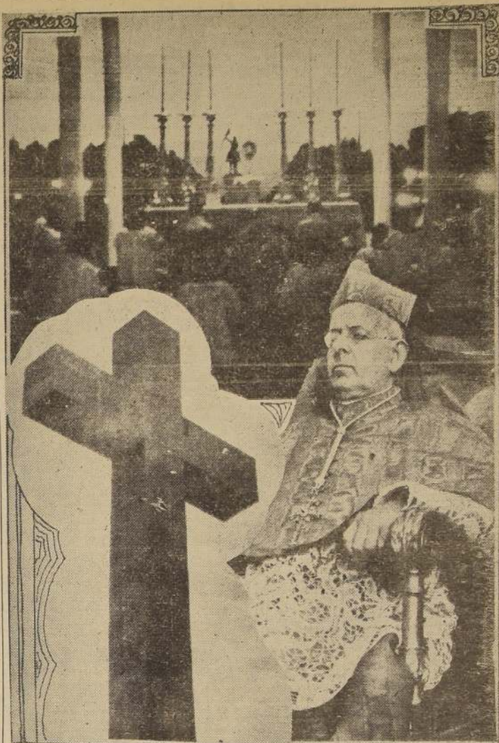
Durante la ceremonia efectuada en la tarde de ayer en el Altar Monumental. — Abajo, a la derecha, Monseñor Copello

En cumplimiento del programa de las fiestas eucarísticas de este Congreso, los Veteranos de Chile, asistirán a los actos de estas fiestas.