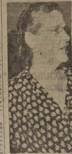
SALVA LOS NIÑOS AZULES. La doctora Helen Taussig presidirá hoy una sesión clínica en el Hospital del Salvador, donde se tratará un niño de los llamados "azules". La destacada investigadora es creadora de la operación que permite salvar temporalmente a los pacientes.

La doctora Helen Taussig, que ayer fue recibida oficialmente por la Universidad de Chile, ofrecerá hoy a las 10.30 horas, una sesión clínica en el