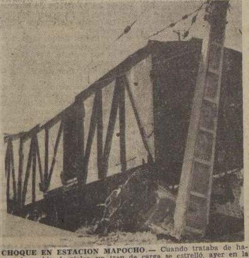
CHOQUE EN ESTACION MAPOCHO. Cuando trataba de hacer el cambio de rieles, un tren de carga se estrelló, ayer en la tarde, con uno de los topos, el cual destruyó parte de un vagón. Este hecho ocurrió a las 15 horas en la Estación Mapocho, produciendo pánico entre algunos operarios que presenciaban la maniobra. Una fuente oficial informó que este accidente se ha repetido por tercera vez en las últimas dos semanas.

Una importante partida de cloromicetina, que alcanza a mil millones de pesos debe llegar al país como término de las gestiones que se hacen en los Estados Unidos, y que a la fecha se encuentran adelantadas.