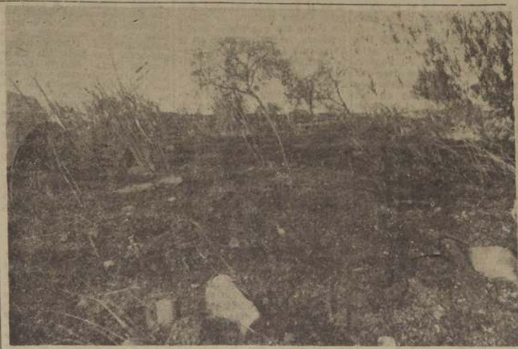
De criminal puede calificarse el descuido de los paseantes que, día a día, con collitas de cigarrillos o las mal apagadas brasas de sus pichones, están devastando el cerro San Cristóbal. Zonas arborizadas de veinte y más años presentan aspecto desolador ante el descuido, la negligencia y la mala intención de los que nada hacen por mantener y aumentar el esplendor de las plantaciones de este popular paseo de la capital.