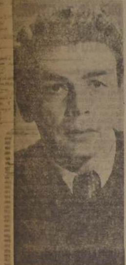
Paul Muni, actor múltiple, figura en la primera fila de los intérpretes cinematográficos en el mundo entero. Fue uno de los que felicitó a Max Factor en la inauguración de su edificio en que todavía funciona el llamado "Templo del maquillaje".

Durante casi diez años el espacio que tenemos desde que nos establecimos en Hollywood fue su-