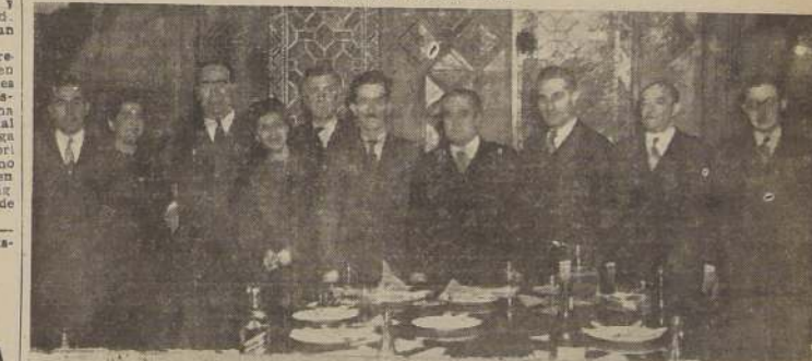
Parte de los asistentes al acto de ayer en el Consejo de la Defensa del Niño