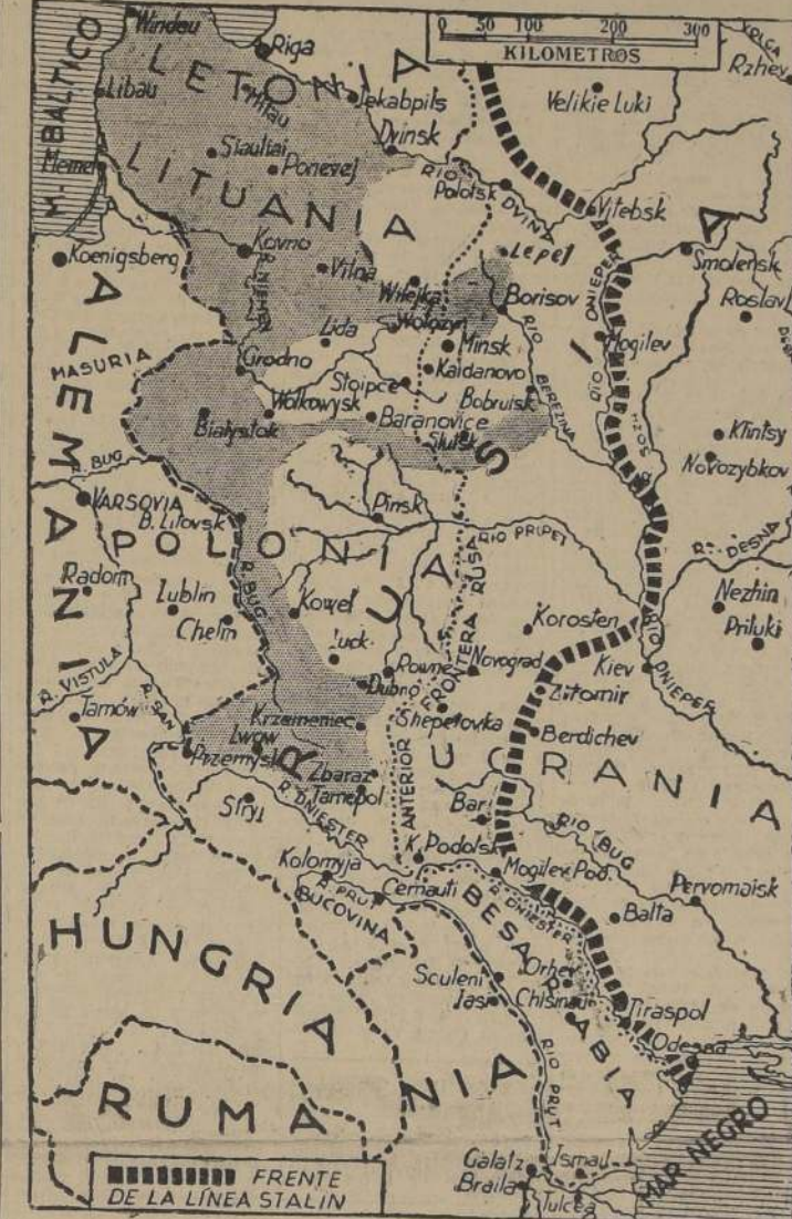
La parte grisada en el presente mapa corresponde a la zona ocupada por las tropas alemanas en su avance sobre Rusia

En el frente finlandés, según otros despachos, las operaciones están principiando a desarrollarse. El importante ferrocarril de Murmansk, según los mismos despachos, ya ha sido interrumpido en diversos puntos por ataques aéreos recibidos ayer por la D. N. B. afirma que todo un ejército soviético fue aniquilado en esta zona habiendo perdido los rusos enormes cantidades de material de guerra, mientras otras informaciones transmitidas hoy describen las operaciones de limpieza para eliminar fuerzas soviéticas que, según se dice, son numerosas en algunos puntos, especialmente en las zonas de los bosques septentrionales donde hacen salidas con el propósito de atacar las comunicaciones y columnas de abastecimientos en la retaguardia alemana.