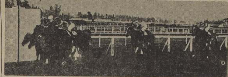
Patou y Mailito, hacen "puesta" en el clásico "Copa Nave Italia", aventajando a Rosee y Latigazo.

Relación y resultados generales de las distintas competencias y noticias diversas