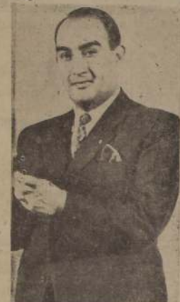
El Cantante de América

RENOVARA SU TRIUNFO INIGUALADO DE OCASIONES ANTERIORES JUNTO CON LA PRESENTACION DE LA GRAN CINTA AMERICANA