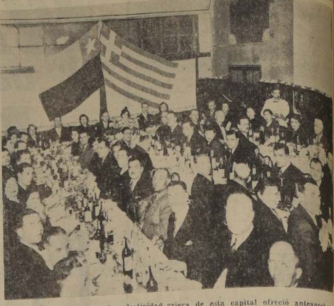
Asistentes a la comida que la colectividad griega de esta capital ofreció anteayer al Restaurante Grecia, al nuevo representante de aquel país, ante nuestro Gobierno, el centesimio señor Basilio Dendramis.