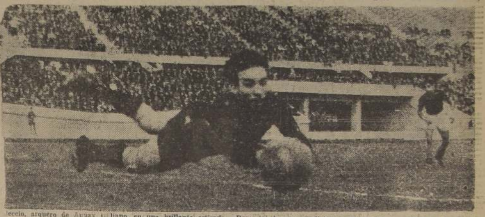
Acción, arquero de Audax Italiano, en una brillante estrada.—Derrota a las condiciones, aunque no se exigía a fondo.