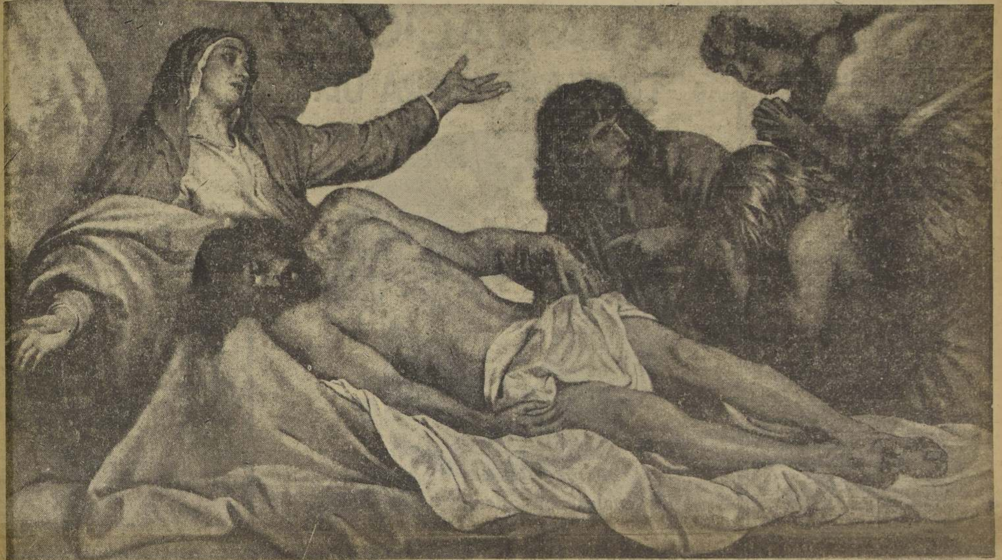
"PIEDAD", obra de Antonio Van Dyck (1599 - 1641), Museo Real de Amberes.