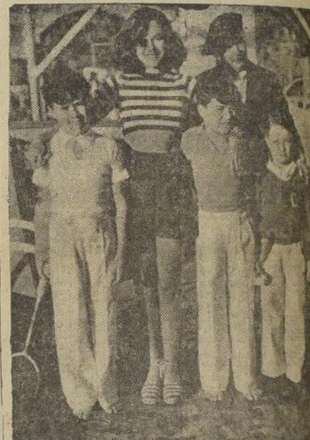
Todo se arregla: Paulette Goddard, la nueva mujer de Carlos Chaplin, rodeada de los hijos del gran cómico. A su lado se encuentra igualmente el célebre escritor inglés Herbert George Wells.