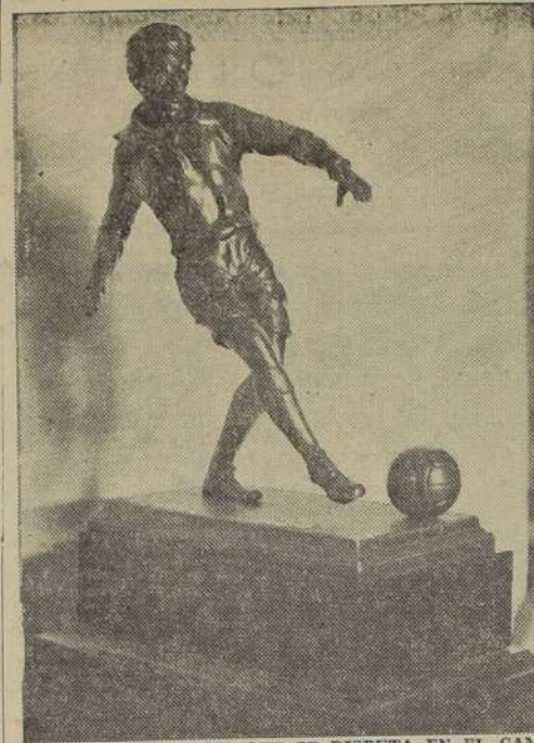
TROFEO "LA NACION", QUE SE DISPUTA EN EL CAMPEONATO DE APERTURA AMATEUR

LAUTARO ATLETICO Los tiempos cambian, de ello no hay duda. Para mí, hasta un año atrás, el Lautaro Atlético, que de la noche a la mañana se ha convertido en el terror de los clubes aficionados. Y es así como San Lorenzo su contendor entrará a la cancha con el optimismo que lo pudo haber en la temporada pasada, sino con gran temor, ya que ha sido testigo del resurgimiento sorprendente de los Lautaros. San Lorenzo ganador de Independencia y Caracas, se ha dado cuenta del compromiso que tiene