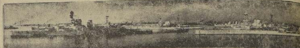
Buques de la Armada Británica, que han estado en constante actividad en el Mediterráneo, desde que estalló la guerra Italo-Etiopie, anclados en el puerto de Alejandría. — A la izquierda se encuentran los acorazados "Renown" y "Exeter", en medio de un grupo de destructores; en el centro se encuentra el porta-aviones "Glorious" y a la derecha los acorazados "Valiant" y "Australia".