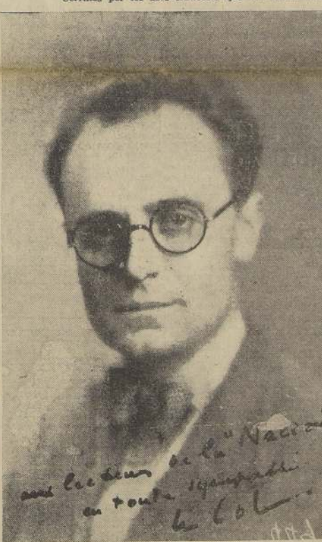
Fotografía de M. Pierre Cot, Ministro del Aire de Francia, con un autógrafo a nuestro diario, que dice: "A los lectores de 'La Nación', con toda simpatía. — P. Cot".