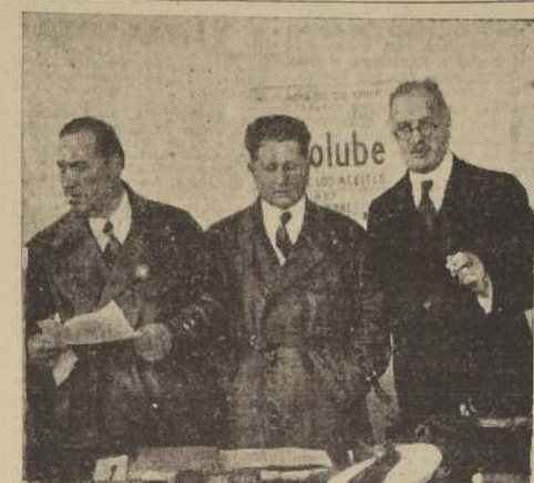
Los pilotos del Farman 22-31 y el Ministro de Francia en Chile, Excmo. señor Conde de Saragat.

En estas circunstancias, hubimos de parar la radio, pues no podía funcionar y quedamos de este modo absolutamente incomunicados del mundo, navegando en la noche, en medio de la tempestad. Esto duró cinco horas y nos agotó considerablemente. 58 HORAS SIN DORMIR A continuación, nuestro entrevistado nos manifestó que durante todo el raid, ninguno de los tripulantes durmió un solo instante, atentos a la maniobra. La alimentación fue frugalísima: pasas, dátiles y, sobre todo, mucha agua fresca y azucar de caña. —Como pueden ver, nos dice Codos sonriendo, un régimen de alimentación muy simple. LA TRAVESIA DE LA CORDILLERA Respecto de la travesía de los Andes, nos manifestó que también había sido un hecho difícil a causa del mal tiempo reinante. El Farman estuvo a poco de media hora buscando un paso en la cordillera con una visibilidad prácticamente nula en medio de una tormenta de nieve. Por fin, lograron atravesarla un poco al norte del Aconcagua, volando a siete mil metros de altura para pasar en seguida sobre el Cristo Redentor. LA MAQUINA MAS PESADA QUE HA CRUZADO LOS ANDES Siempre hablando de la travesía de la cordillera, Reine nos apunta que el Far-