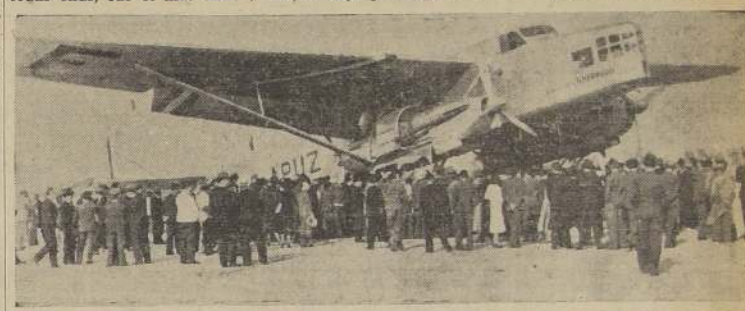
En esta fotografía puede apreciarse la magnitud del Laurent Guerrero, una enorme máquina aérea que pesa 19 toneladas.