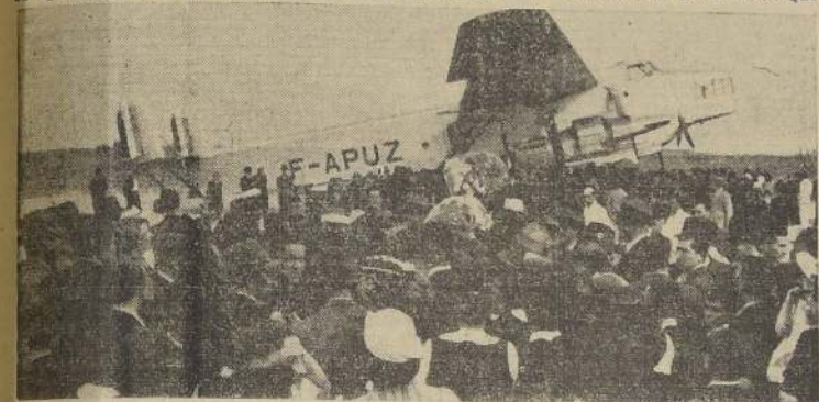
Un numeroso público va hacia el avión a recibir a los pilotos en el momento de su llegada a Los Cerrillos.