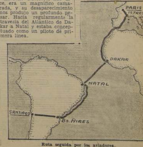
Ruta seguida por los aviadores.

Luego le transmitió algunas impresiones del raid, la hora de su llegada a Los Cerrillos y la recepción que se le acababa de tributar. Le comunicó, asimismo, que permanecerían en esta capital por espacio de 48 horas.