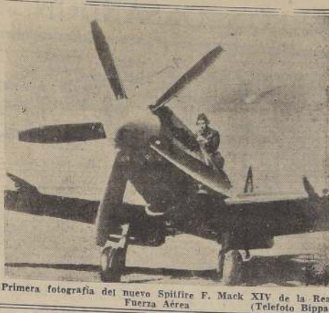
Primera fotografía del nuevo Spitfire F. Mack XIV de la Real Fuerza Aérea

BOMBARDEROS Y CAZAS APCYAN AVANCE ALIADO