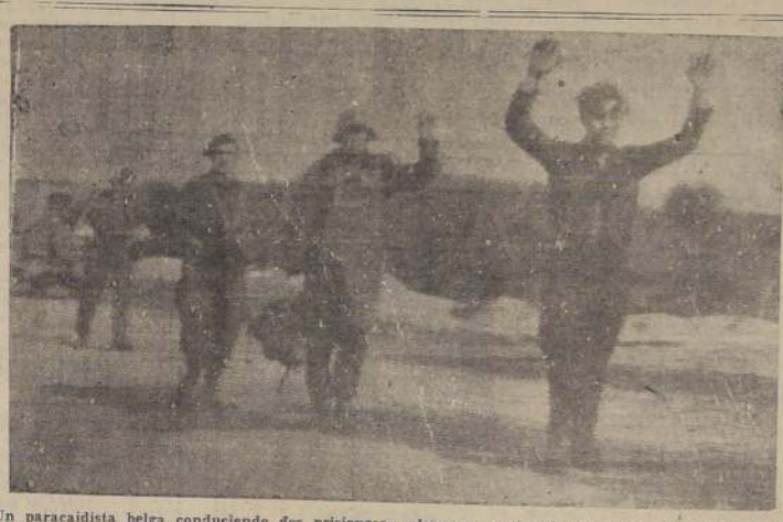
Un paracaidista belga conduciendo dos prisioneros alemanes capturados durante la última campaña de la infantería aérea aliada en Holanda