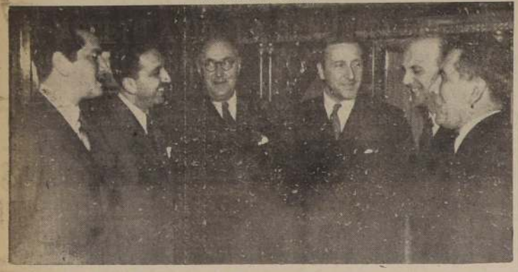
El Ministro de Justicia acompañado de funcionarios del Ministerio, después de haber hecho entrega del cargo