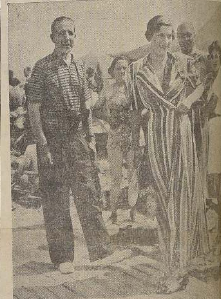
Lord y Lady Willoughby, juntamente con otras altas figuras de la sociedad británica, pasan el verano en la playa de Deauville.