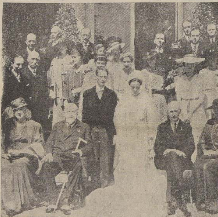
Durante el matrimonio del Príncipe Augusto Csarotyski y la princesa Dolores de Orleans-Borbón en Lausana, lo que dio origen a una reunión de todas las familias reales de Europa.