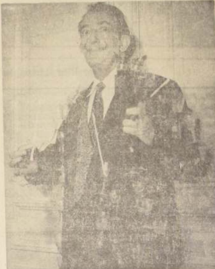
El exuberante Salvador Dali se precave de que no le falten copas cuando asiste a una fiesta. Ahora está trabajando en el montaje de un ballet que resumirá a través del mito de Tristán e Isolde y la cosmología de Teillard de Chardin, la concepción del mundo del propio Dali, "egocéntrica e intrauterina".

res respuestas a cualquier clase de preguntas. Y ésta fue la última contestación de Salvador Dali.