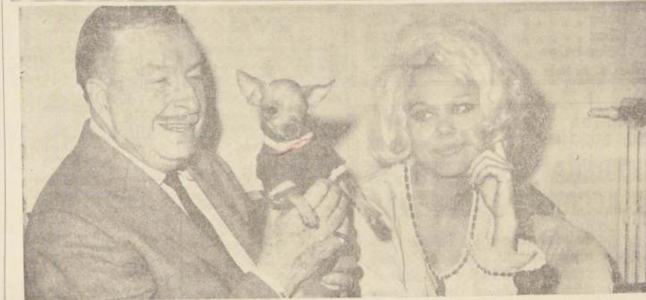
XAVIER CUGAT se echó al hombro los 42 años de diferencia entre sus 65 los 23 de Charito Baeza. Le ofreció matrimonio después de trabajar juntos una temporada de tres semanas en "Las Vegas". Este será el cuarto matrimonio de Xavier. "El primero con cristiana" — declaró. Antes se había casado con hebreas. El perrito da la medida del entusiasmo de cada uno de los conuges.

REVISTAS OPERA, Hufoneros 837 (30176). — 19, 21.40 y 23.15 horas. Cía. de Revistas Film Sam Bum, presentando: "Caravana en Color". COUSINO SAN IGNACIO 1249 (30657). — 19.30 y 23.30 horas. Cía. de Revistas "Humorquero". PICARESCO, Recoleta 348 (372606). — 19.30 y 23 horas. Cía. de Revistas Strip-Tease.