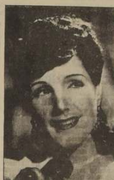
Libertad Lamarque, la estrella del cine y "La Viejecita", "Los Claveles" y "Luisa Fernanda", hoy en el Municipal

de la Canción debutará el 22 en el Teatro Baquedano