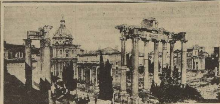
El Panteón de Agripa en el Foro de Roma