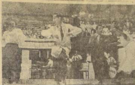
HOY PONEN NOTAS EN CAMPEONATO DE BAILE.

LA PALMILLA — R. Esta es mi vida. La que agoniza. Rica. Joven. Sinopsis. LAS LILAS — M. V. y N. Rivalry. Sinopsis.