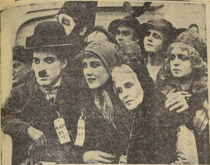
La escena muestra al genial Charles Chaplin a la llegada a Nueva York en la película "El emigrante" que desde hace muchos años no se exhibe. Sin embargo no por ello ha perdido su frescura, sentido del humor y valor como una de las más completas muestras del humorismo del cine mudo. El público de las generaciones