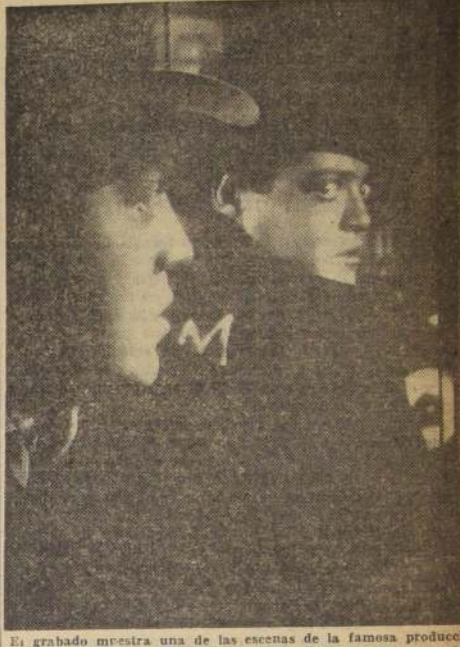
El grabado muestra una de las escenas de la famosa producción alemana dirigida por Fritz Lang, "El vampiro negro", una pieza de inestimable valor histórico cinematográfico que figura entre los 7 mil títulos que mantiene la cineteca del SODRE, de Montevideo, Uruguay. Muchas películas antiguas, olvidadas en Chile y viejas bóvedas a las que ya nadie da valor alguno, poseen también este valor. La Universidad de Chile las recogerá como la primera base para formar la Cineteca Universitaria.

En el aspecto docente la cineteca coleccionará todas aquellas películas relativas a asuntos científicos, culturales o artísticos que digan relación con los programas de las diversas carreras de la Universidad. En el aspecto de investigación se coleccionará todo el material que sea necesario para la difusión del Instituto de Cinematografía organizará ciclos