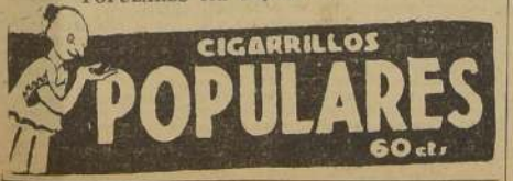
(De “El Romancero de Pipo”)

Y en ese “dolce far niente” fumemos, continuamente, POPULARES con boquilla!