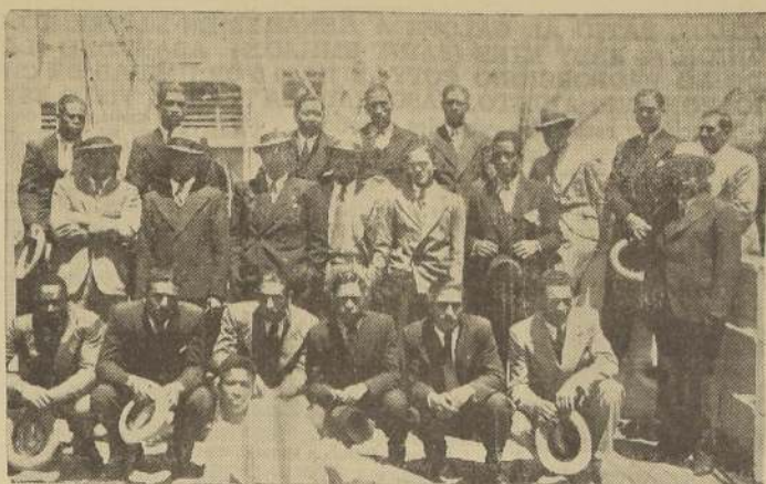
Los componentes del Alianza posan para "LA NACION", a bordo del "Santa María", a su llegada a Valparaíso

A las personas interesadas se les atenderá hoy solamente, hasta las 20 horas, en la secretaría del club, San Diego 110.