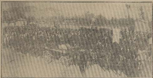
Aspecto de una parte del pueblo que acudió á solemnizar el acto de la inauguración del monumento

Melipilla cobró ayer su día de gloria y lo clavó en la plaza como un homenaje que satisface el orgullo justo de la villa natal del segundo oficial de la "Emmeralda" en el momento de su coronación por la grandeza de la patria.