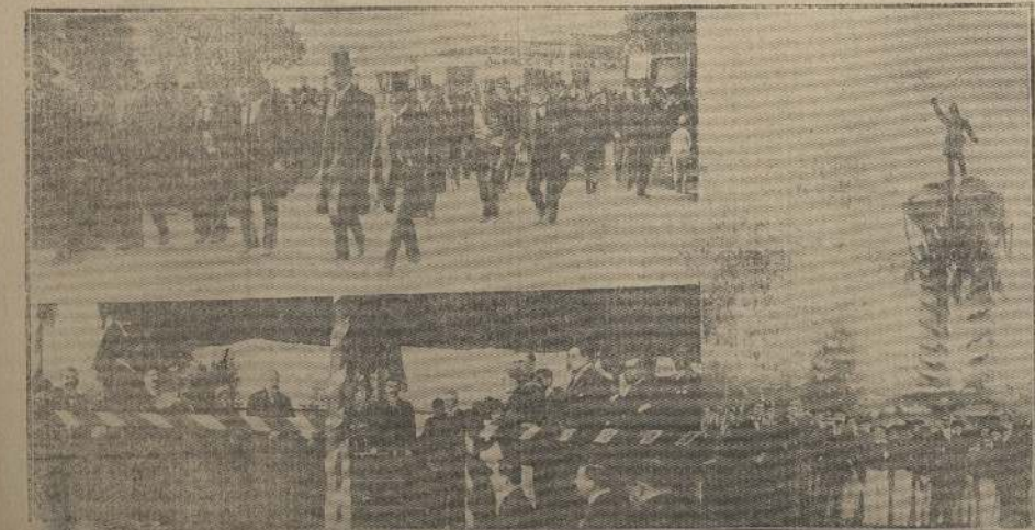
1.—El Ministro accidental de la Guerra, don Pedro García de la Huerta, y la comitiva oficial, acompañados de las autoridades locales, entrando á la Plaza de Melipilla. 2.—La tribuna oficial donde se pronunciaron los discursos en el acto de la inauguración del monumento á Serrano, después de la inauguración.

Agua de Colonia especial de la casa Ismael J. Blanco.