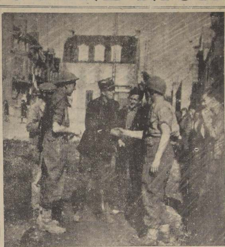
En la ofensiva al sur de Caumont las fuerzas británicas conquistaron Le Beny Bocage. Aquí vemos a algunos habitantes y un gendarme que dan una cálida bienvenida a las tropas