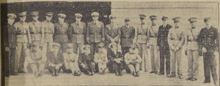
Alumnos del 3.º Curso

La Escuela de Aviación acaba de poner término al período de instrucción correspondiente al año 1934; para finalizar el año, la Escuadrilla de Aplicación hará un raid a Puerto Montt, con el objeto de que todos los oficiales conozcan aquella par-