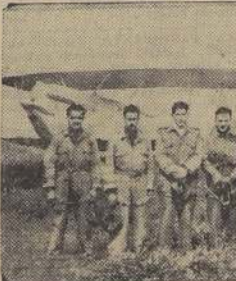
Los pilotos de la Escuadrilla de Aplicación