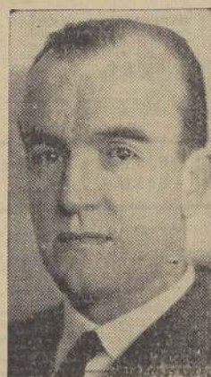
Don Manuel Franke M., Comandante de Grupo, Jefe del Estado Mayor de la Fuerza Aérea Nacional

estos oficiales pasan a la Escuadrilla de Aplicación, donde ya la instrucción se hace más delicada y más difícil. El material aéreo en el cual trabajan esta escuadrilla es material de guerra, y la instrucción capacita a los oficiales para recibir su título de "Piloto de Guerra"; es decir, los deja aptos para ejecutar todas las prácticas de Tiro, Bombardeo, Radio, Navegación, Fotografía, etc.