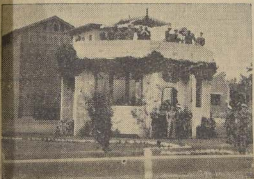
Comodoro don Diego Aracena y Oficiales de Estado Mayor presenciando las diferentes pruebas que le eran transmitidas por radio-telefonía a los pilotos que efectuaban ejercicios en el aire

La Escuela de Aviación acaba de poner término al período de instrucción correspondiente al año 1934; para finalizar el año, la Escuadrilla de Aplicación hará un raid a Puerto Montt, con el objeto de que todos los oficiales conozcan aquella par-