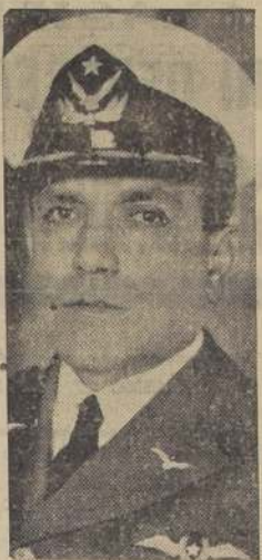
Don Diego Aracena Aguilera, Comodoro del Aire, Comandante en Jefe de la Fuerza Aérea Nacional

Para su mejor funcionamiento, la Escuela de Aviación está dividida en dos Escuadrillas: una de Instrucción y otra de Aplicación. La primera recibe anualmente cierto número de oficiales, provenientes del Ejército y de la Marina. Estos oficiales reciben durante el año la instrucción necesaria para recibir su título de piloto, es decir aquella instrucción que les da el dominio del avión. Al final del año y previas las pruebas exigidas por los reglamentos de la Instrucción,