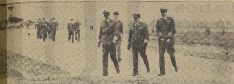
Comandante en Jefe de la Fuerza Aérea Nacional; Jefe del Estado Mayor y Director de la Escuela, dirigiéndose a tomar examen a los nuevos oficiales aviadores

La Escuela de Aviación terminará el período de Instrucción con un raid a Puerto Montt