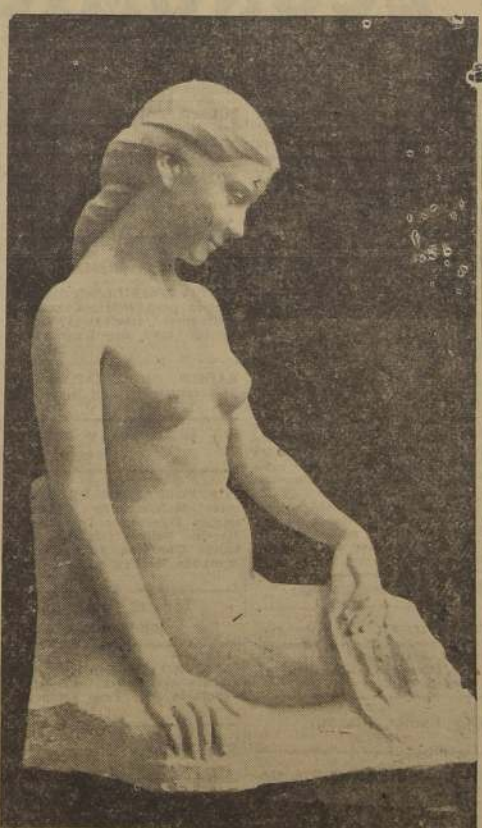
"Melodía inconclusa", escultura de Oscar González Cruz, que obtuvo medalla de oro en el Salón de la Sociedad Nacional de Bellas Artes