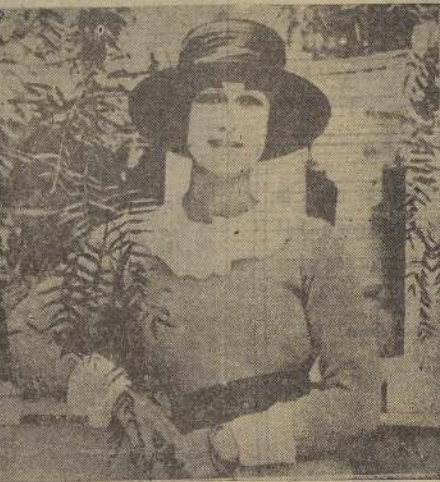
LA DUQUESA DE WINDSOR