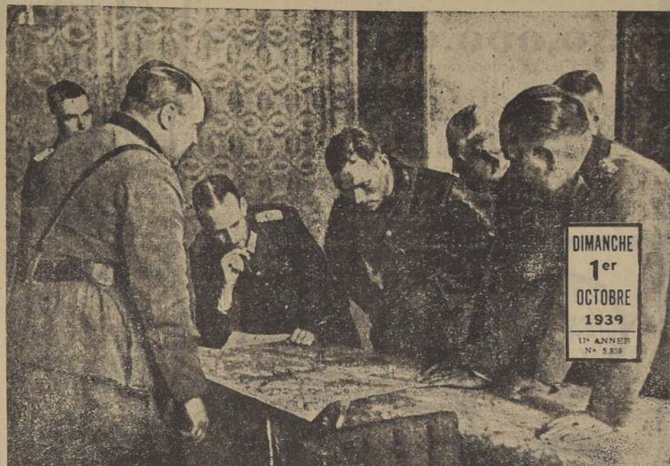
El plenipotenciario ruso Borowski, el de blusa de cuero, estudia el mapa de Polonia rodeado de oficiales del comando alemán, antes de trazar la línea provisional de demarcación de las esferas de influencia rusa y alemana.