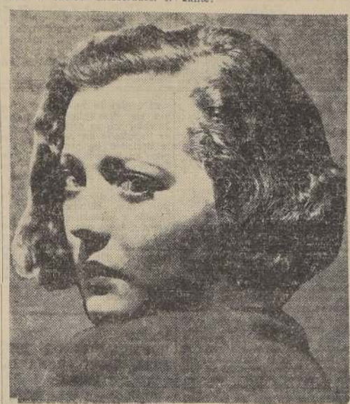
Silvia Sidney, que protagoniza el drama policial "Amor y Crimen", que se da a conocer hoy en la pantalla del Santiago

Esta producción, que hoy estrena el teatro Santiago, nos muestra la vida inquieta, llena de terrores y angustias, de una muchacha buena y delicada, de quien se enamora violentamente un acaudalado, joven y arrogante.