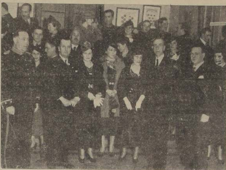
Grupo de asistentes a la recepción ofrecida ayer por la Dirección de la Academia de Guerra, con motivo de su 51.º aniversario, y a la cual asistieron el Ministro de Defensa Nacional, Adictos Militares extranjeros y altos jefes de las fuerzas armadas.

— AL — SINDICATO ORQUESTAL. SAN DIEGO 114, TELEFONO N.º 64431.