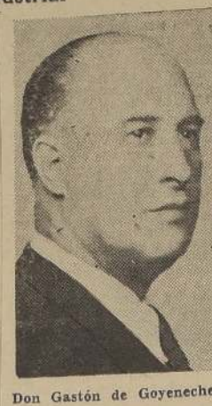
Don Gastón de Goyeneche

En resumen, trabajemos más, produzcamos más, fomentemos nuestras exportaciones en vez de estorbarlas.