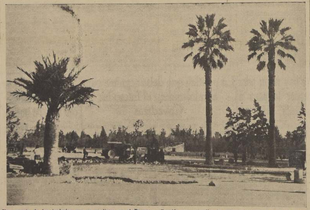
Un aspecto de los trabajos que se realizan en el Parque Cousiño para ampliar la entrada que da a la Plaza Ercilla.

LA REVISTA PREPARATORIA SE POSTERGO PARA EL 16