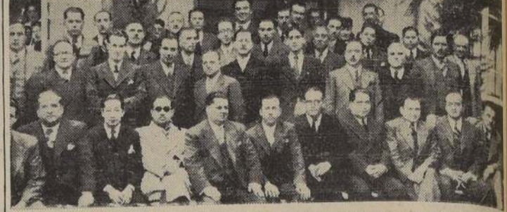
Parte de los dirigentes, socios y personas invitadas que asistieron a las festividades con motivo del segundo aniversario del "Sindicato Profesional de Distribuidores de Agua Mineral Central Panamericana". Los actos realizados alcanzaron el más completo éxito.

Nómina de los directorios nombrados por los obreros de Landea, Galmes y Santos, E.E. Ferroviarios y otras organizaciones