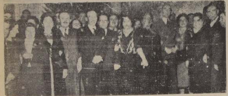
Un aspecto de las reuniones celebradas por el Sindicato de Comerciantes en Subsistencias de Terres y Mercados, en las cuales se rindió homenaje a S. E. y al Asesor Jurídico de la institución. Aparecen en la foto algunas de las personalidades asistentes y dirigentes sociales especialmente invitados.

PERSONALIDADES QUE ASISTIERON A ESTOS ACTOS