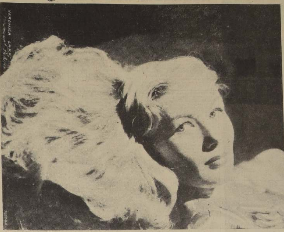
VERONICA LAKE, cuyo retrato publicamos, desempeña un rol sobresaliente en la sensacional producción "VUELO DE AGUILAS". que el público podrá conocer desde hoy en el Teatro Real, de nuestra capital. La encantadora artista, según cuentan algunos cronistas, ha hecho destrozados sentimentales entre sus admiradores, y en "VUELO DE AGUILAS" no hace sino confirmar sus antecedentes. Es interesante hacer notar la circunstancia curiosa de que Verónica Lake no quería ser artista de cine cuando llegó a California hace dos años.