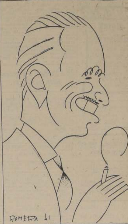
Douglas Fairbanks Jr., quien se encuentra en Santiago en misión especial como enviado extraordinario del Presidente Roosevelt.