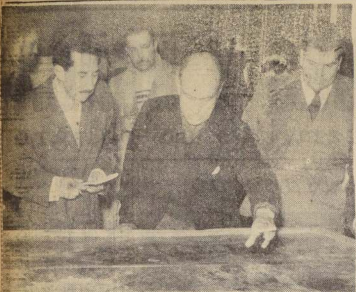
El Ministro de Obras Públicas, general Eduardo Yáñez Zavala, muestra a un reportero de LA NACION, sobre una carta aerográfica del gran Sáhago, los puntos más afectados por los desplazamientos de agua de la cordillera, que debió el Mapocho y tres canales que penetran profundamente sobre el plano metropolitano. El Ministro, en tenida gruesa, mostraba todavía en

sus pantalones y zapatos el barro y el agua durante su día, ayer en la madrugada, por el sector de Las Condes, Nuñoa, puentes Bulnes y Matucana. Al fondo, el Alcalde de Las Condes, señor Alvaro Salameiro, y a la izquierda del Ministro, el Alcalde de Santiago, don Fernando Gorroño.