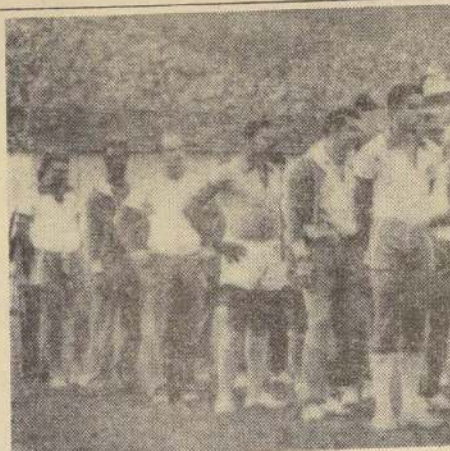
EN UN CAMPO de entrenamiento de Suecia aparecen varios de los jugadores de Brasil. El equipo sudamericano se ha transformado en la sensación del torneo por la Copa del Mundo, y la mayoría de los técnicos le asignan la primera chance en el empate con Inglaterra. Y su valla no ha sido vencida, excepto con el vencedor de Hungría y Gales.