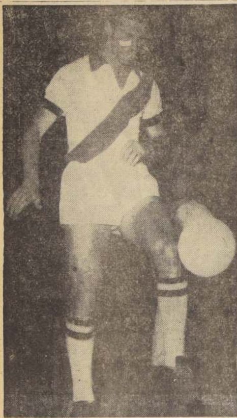
CAPITAN y zaguero centro de Brasil, Bellini ha sido uno de los puntales del cuadro que se ha convertido en sensación del Mundial de Suecia.

PUDO HABER SIDO MAS AMPLIO EL SCORE. PERO, CON LA VICTORIA ASEGURADA, SE DEDICARON A UN JUEGO PRECISISTA, DE LUJO.— VAVA HIZO LOS DOS GOLES.— GILMAR SIGUE CON SU VALLA INVICTA