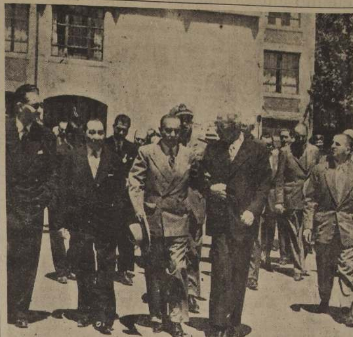
CONVENCIÓN DE TÉCNICOS EN CIENCIAS ECONÓMICAS.— El Presidente de la República, Excmo. señor González Videla, llega al local de la Universidad Santa María, con el objeto de inaugurar este importante torneo, que reúne a numerosas delegaciones de países americanos, y el cual se adoptarán interesantes acuerdos para enfocar la realidad económica de América.