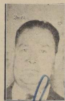
Ayer dejó de existir en la Clínica Alemán a la edad de 45 años, después de una delicada operación.

El Pensionado Universitario de Niñas, ubicado en Avenida España 311, ofrecerá un almuerzo de despedida hoy sábado 24, a la señora Amanda Labarca con motivo de su próximo viaje a los Estados Unidos. A esta manifestación concurrirán el Rector de la Universidad de Chile, don Juan Hernández y otras autoridades educacionales.