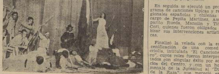
Homenaje de la juventud del Centro Republicano Español al "Día de la Raza"