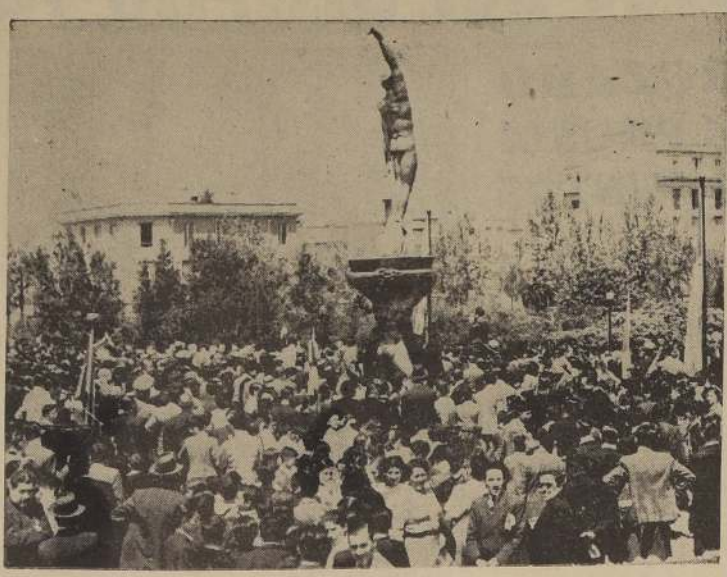
Parte de la concurrencia que asistió al acto de ayer