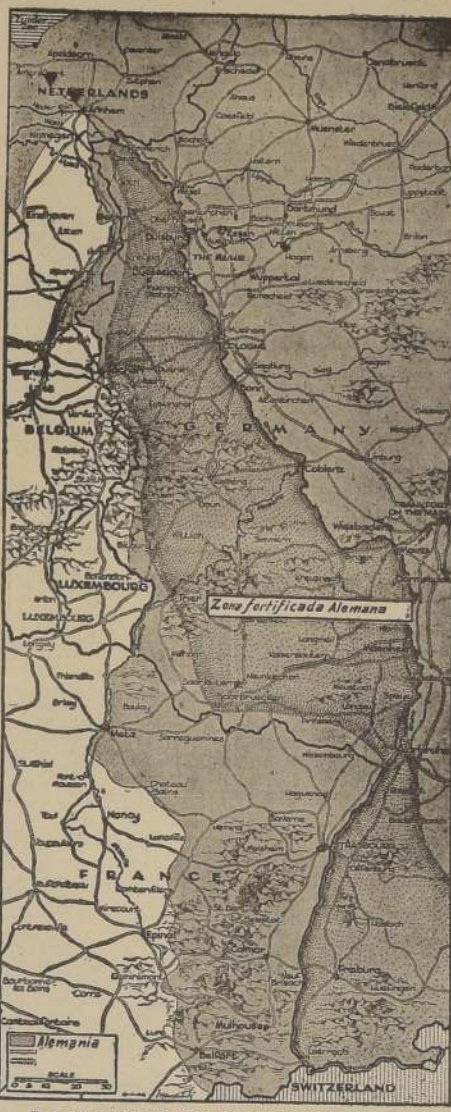
El frente occidental desde Holanda a Belfort.

Cinco kilómetros al suroeste de Livigno los norteamericanos