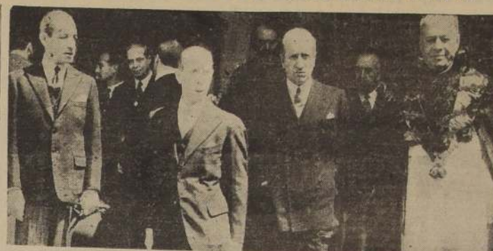
El Embajador de España, Marqués de los Arcos, acompañado del Ministro de Relaciones Exteriores y del Embajador de Argentina en la Iglesia Catedral

Quien sirva al niño de hoy servirá a la Patria de mañana. Semana del Niño de 1944.