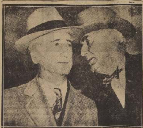
El Secretario de Estado, quien ha continuado con la política exterior de Truman, en la conducción de la política de Estados Unidos en las conferencias de París y en la Asamblea de las Naciones Unidas, tiene muchas probabilidades de ser elegido presidente del Senado.