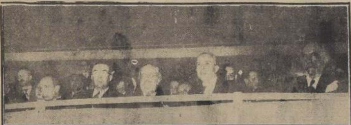
EN EL PALCO PRESIDENCIAL.—El Excmo. señor Gabriel González Videla y los Vicepresidentes de Argentina, Brasil, y Perú, presencian el desarrollo del festival.

En lo que al match de fútbol se refiere, principal incentivo del programa, el conjunto representativo de la Universidad Católica obtuvo un justo triunfo por la estrecha diferencia de un gol. El score de 1-0 resulta demasiado elocuente para apreciar los merecimientos de uno y otro elenco, y la labor que ejecutaron en su afán de superarse. Por cierto que el desenlace del cotejo era de im-