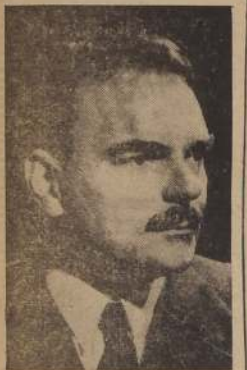
Mr. John Dewey, reelegido Gobernador del Estado de Nueva York, y probable candidato a la Presidencia.