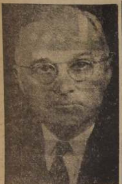
El Presidente Truman, quien deberá gobernar afrontando la oposición de ambas Cámaras, durante los dos años que le restan para terminar su período presidencial.