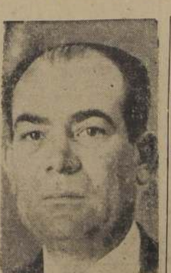
Don Roberto Wachholtz, Ministro de Hacienda, Economía y Comercio.

Dentro de estas finalidades y a través de la Comisión de Crédito Público y otros mecanismos legales, se mantendrá un estricto control de las emisiones de bonos de la Deuda Interna, lo mismo que las de la Caja de Crédito Hipotecario y demás Institutos similares, para que todas ellas se ciñan al criterio que se acaba de expresar, y para que, de este modo, en ningún momento tales emisiones se efectúen excediendo o violentando la capacidad del crédito que, en la justa medida, debe destinarse a este objeto, sin perjudicar las disponibilidades de crédito que deben reservarse a la iniciativa particular en su rubro de fomento a la producción. Por consiguiente,