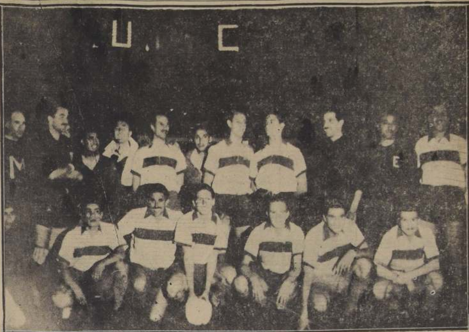
EL VENCEDOR.—El conjunto representativo de la Universidad Católica que se adjudicó el triunfo por 1 goal contra 0. En general, agradó el desarrollo del espectáculo.