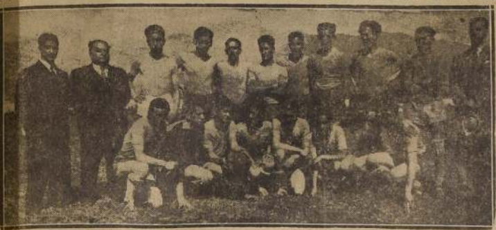
El seleccionado del Instituto Comercial de Concepción.

EL INTERNADO BARROS ARANA FUE EL CONTENDOR DEL INSTITUTO COMERCIAL