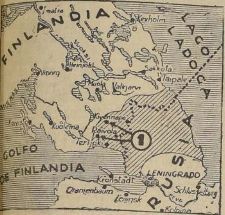
No 1: Kivimäki y Raivola, dos de las ciudades conquistadas por las fuerzas rusas. — Rayado diagonal: zona ocupada por los ejércitos rusos. Línea cortada: el frente antes de iniciarse la actual ofensiva.