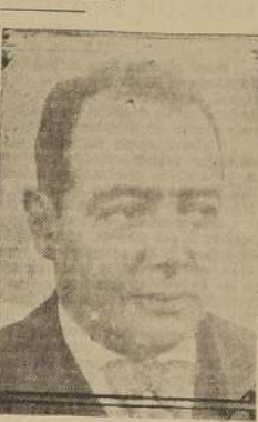
de ayer a agradecer a S. E. el Presidente de la República, haya sido recibido con general beneplácito.