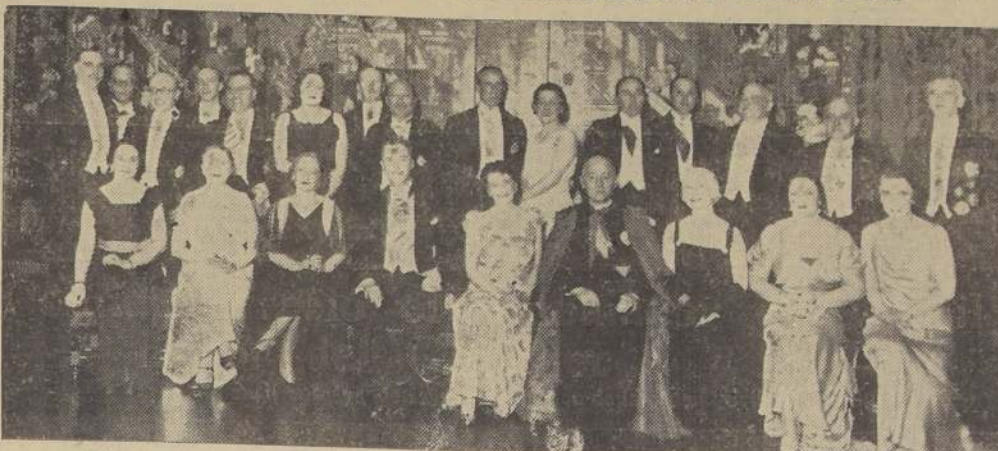
Asistentes a la comida ofrecida anoche por el Embajador del Brasil y señora, en honor del Canciller

Se le hizo entrega de la condecoración de la orden "Cruzeiro do Sud"