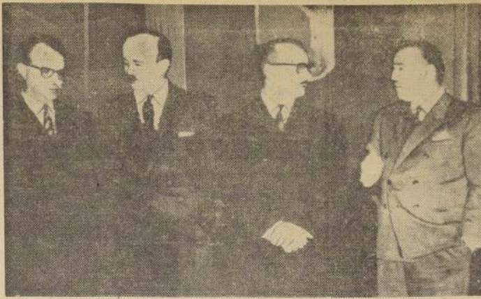
Buenos Aires. — Después de la renuncia de Frondizi, se puede ver aquí, el 23 de junio, a los líderes de la mayoría de los partidos políticos. — (Radiofoto UPI).

El primer día de la visita del general francés terminó con una gran recepción, y se esperaba que el primer día de la visita del general francés terminara con una gran recepción.