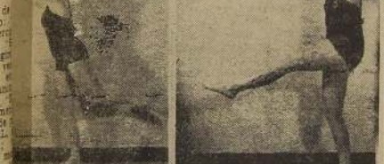
FIGURA 6 D. —En seguida llevar la pierna izquierda al lado de la derecha.