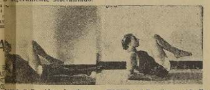
FIGURA 6 B. —Alzar lentamente la pierna derecha, doblando la rodilla hasta que se encuentre en ángulo derecho.