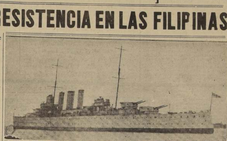
El "Cornwall" que junto con el "Dorsetshire" fue hundido en el Océano Indico, fue construido en 1928 y desplazaba 10.000 toneladas

WASHINGTON, 9. (U. P.).—La denodada resistencia que durante cuatro meses mantuvieron las fuerzas norteamericanas y filipinas en la isla de Luzón terminó hoy bruscamente con el derrumbe de las defensas de la península de Batán.